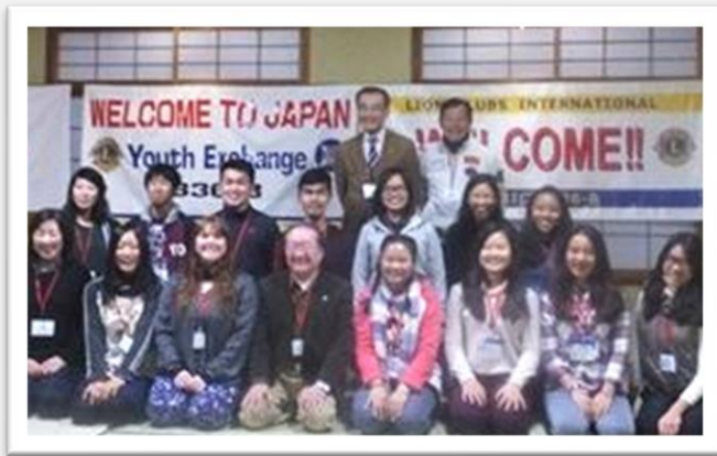
Ystävyysklubit & nuorisovaihdon ohjelmat