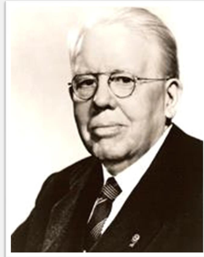
Melvin Jones, perustaja

“Et pääse kovinkaan pitkälle ennen kun teet jotain jonkun toisen hyväksi.”