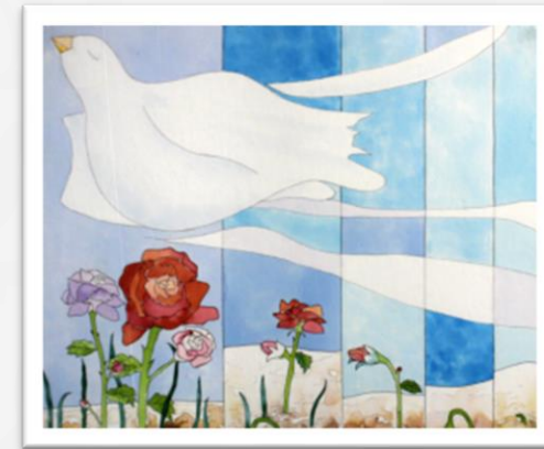
Rauhanjuliste- & esseekirjoitus-kilpailut