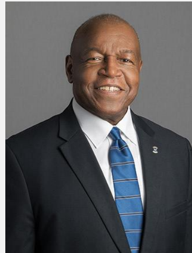
2. Varapresidentti Brian E. Sheehan USA