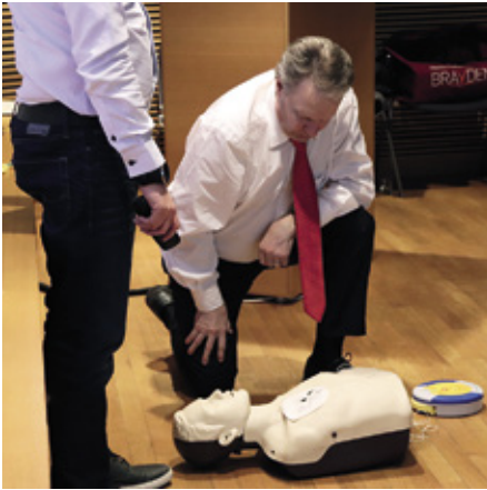
Minister Ilkka Kanerva testar hur lätt det är att använda en defibrillator.