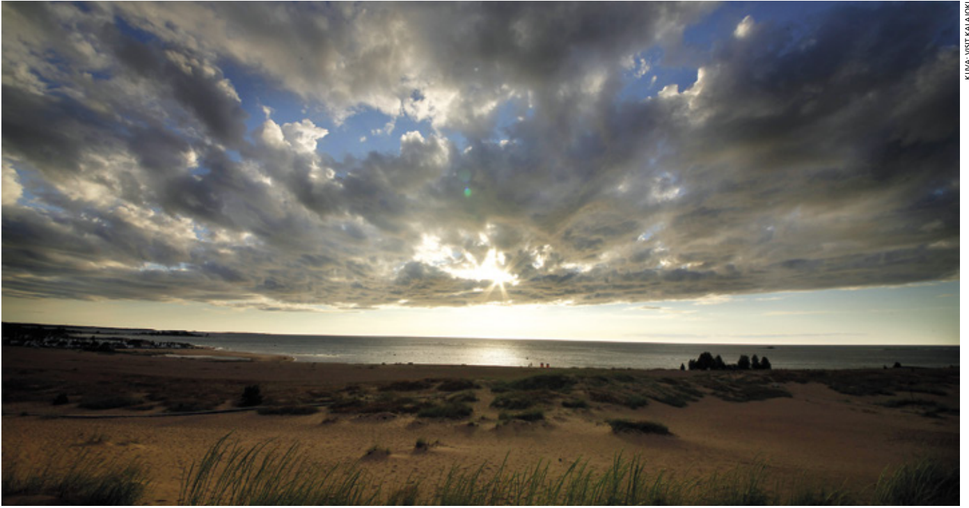
Vuosikokouksen teemana on Puhdas meri, puhdas maa.