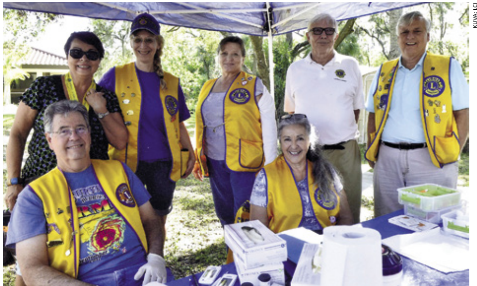
Lionit ovat sitoutuneita parantamaan ympäri maailmaa asuvien diabetesta sairastavien ihmisten elämänlaatua.