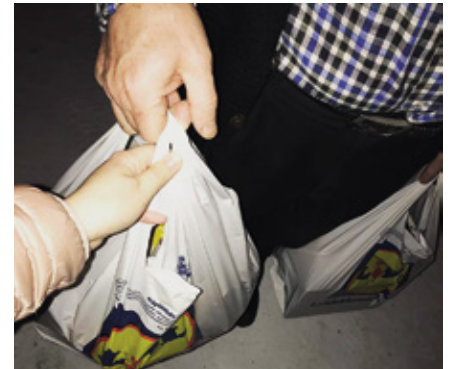
Ruokakasseja apua tarvitseville.

Näihin sanoihin päättäen, kohti kevättä, kohti valoa, tasapuolisesti tsemppiä kaikille tuleviin haasteisiin, yhdessä ne selvitämme. Sillä me palvelemme, yhdessä! •