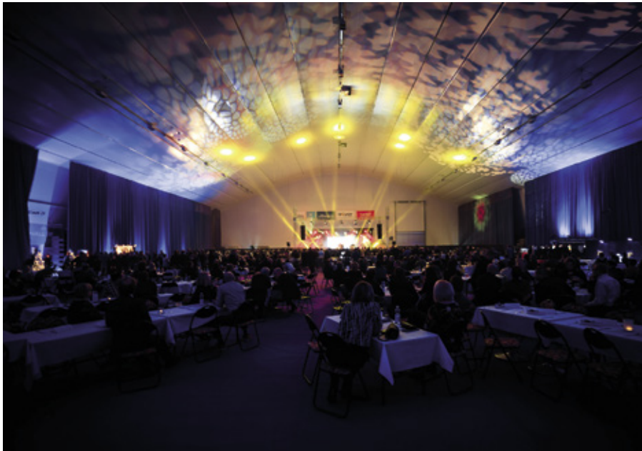
Vuosikokouksessa vietetään näyttävää iltajuhlaa näissä vaikuttavissa tiloissa.