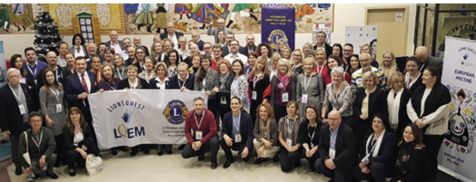
Lions Quests Europamöte (LQEM) hölls i Warszawa i Polen med 85 deltagare från 32 länder, av vilka flera länder första gången deltog i utbildningen.