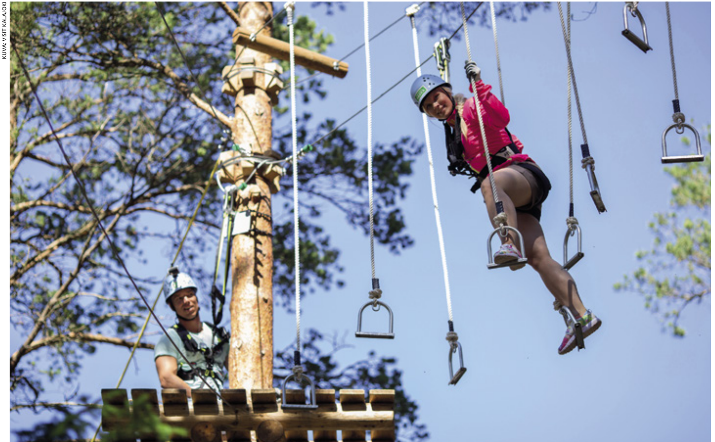
Kalajoella voit käydä muun muassa seikkailupuistossa.

– Vuosikokousviikonloppuna on myös Kalajoen kesäkauden avaus, joten alueella on varmasti tuolloin mukava tunnelma ja paljon tekemistä paitsi leijonille, myös heidän perheilleen ja läheisilleen. Toivomme Lionseille oikein onnistunutta vuosikokousta ja toivotamme osallistujat tervetulleeksi myös muulloin Kalajoelle viettämään vapaa-aikaa ja kokoustamaan, Nakkula toivottaa. >>>