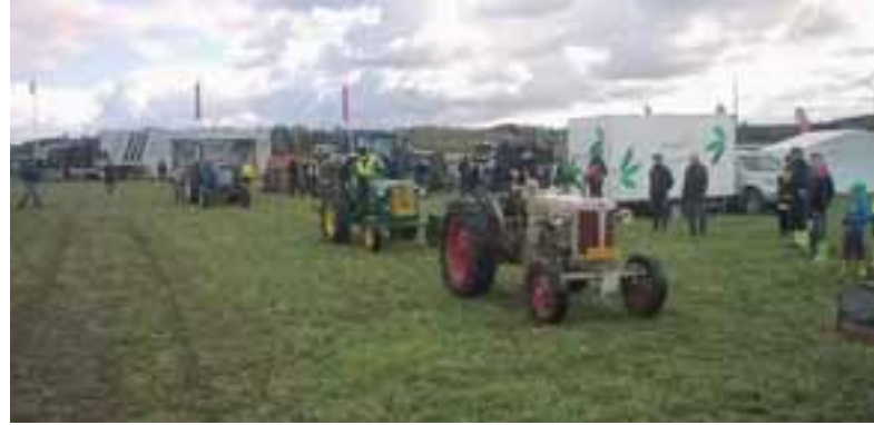
Traktoriparaati SM-kyntökilpailujen kunniaksi.