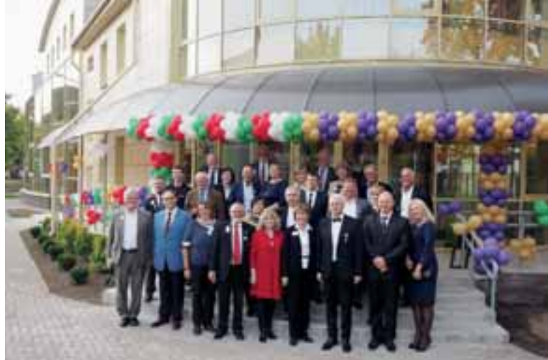
Kansainväliset vieraat keskuksen pääovella.