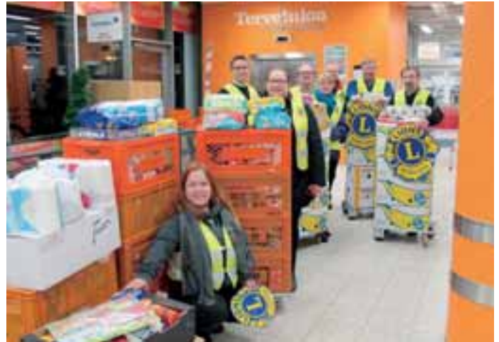
Neljän klubin yhteistyöllä lahjoitettiin joulumieltä Ensi- ja turvakodin asukkaalle.

Jos lionstoiminta ei ole vastannut odotuksia ja toiveita, on helppo ymmärtää, että seurauksena on pettyminen ja kyllästyminen. Tämä voi johtua joko siitä, että odotukset ovat olleet epärealistisia tai toiminta ei ole