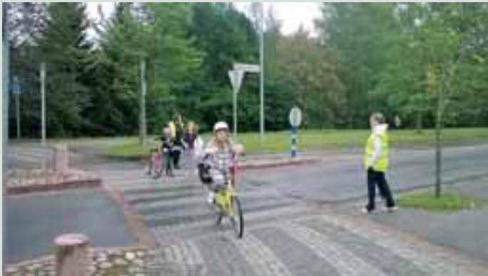
Huomioliiveillä varustetut leijonat ja ladyt risteyksissä ja liikenneympyrässä kiinnittivät autoilijoiden huomion, että tiellä on pieniä kulkijoita.

LC Kärkölä päätti keväällä 2016 olla jälleen mukana syksyn ensimmäisen koulumatkan turvaamisessa. Jo edellisvuoden tietojen ja kokemusten perusteella oli turvaajilla tiedot Järvelän taajaman vaarallisiksi todetuista kohteista, joita koululaiset käyttävät koulumatkoillaan. Yhdessä koulun ja LC Kärkölän toimesta päätettiin jälleen turvata nämä vaarallisiksi todetut teitä ylittävät suojatiet ja keskustan liikenneympyrä. Myös Hämeen poliisilaitos lupautui omalta osaltaan valvomaan ensimmäisen koulumatkan sujuvuutta.