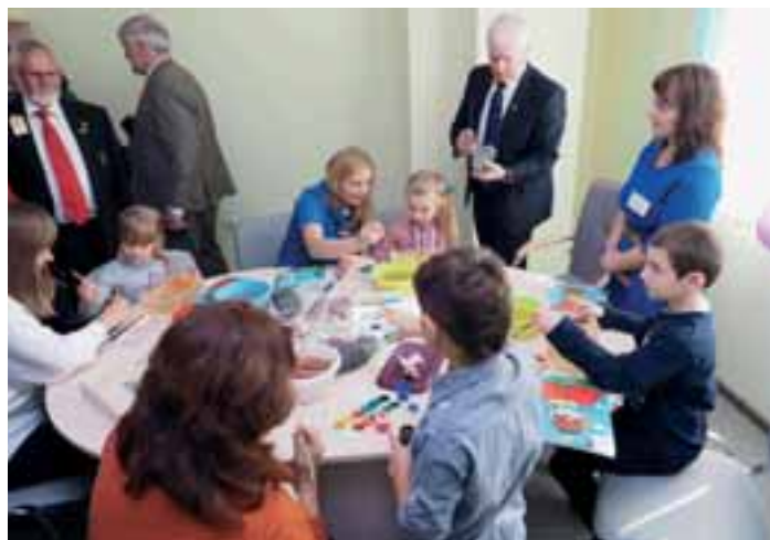
Konstterapistund för barn.