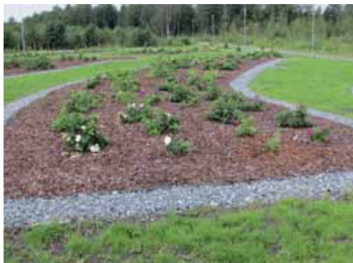
Ensimmäiset ruusut ehtivät jo kukkimaan.

Ruusut on toimittanut Oulujoen Taimisto ky Muhokselta. Sieltä aktiivisesti mukana ollut Matti Kulju kertoo, että kaikki ruusut ovat omalla tavallaan erikoisruusuja.