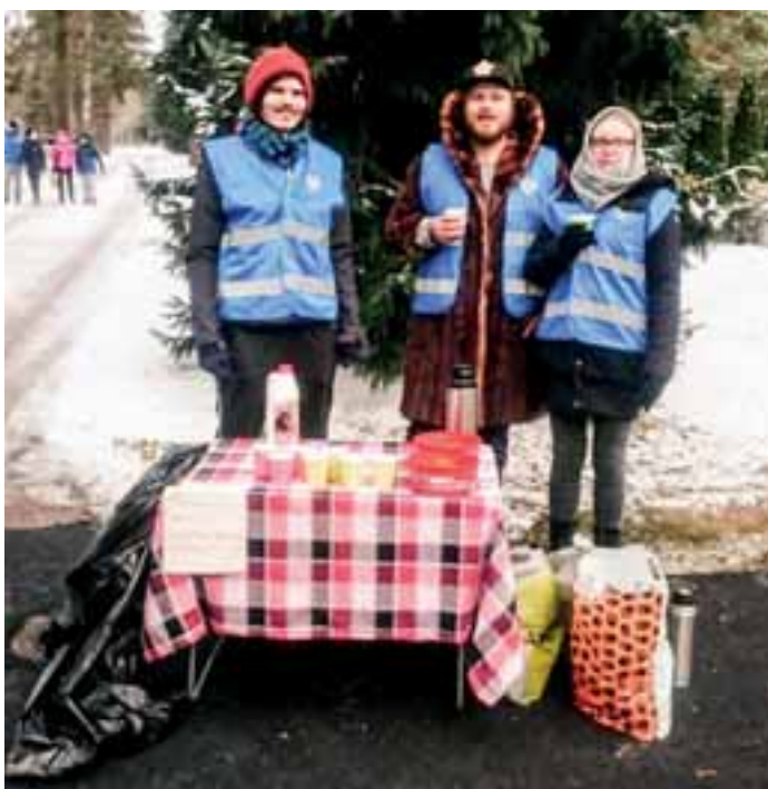
Leo Club Espoo/Downtown viettämässä Hyvänmielenpäivää Honkanummen hautausmaalla.