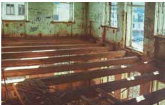
NSR-projekti vanhan lastentarhan remontoimiseksi syöpälästen kuntoutuskeskukseksi käynnistyi näin huonoista olosuhteista.