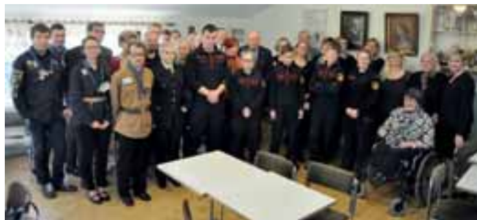
Lahjoitusten saajat yhteiskuvassa.

Lions Club Lempäälä tunnetaan erittäin vireästi toimivana klubina. Lempäälän kuntalaisten keskuudessa klubi tunnetaan erityisesti järjestämistään Nurmen lavan tansseista kesäperjantaisin. Tanssien tuotto mahdollistaa klubille Suomen oloissa poikkeuksellisen merkittävän avustustoiminnan. Viimeisten 10 vuoden aikana klubi on lahjoittanut noin 215 000 € erilaisiin tarkoituksiin. Noin kolmannes avustuksista on kohdistunut nuorisotyön ja liikuntaharrastusten edistämiseen, noin 15 prosenttia vanhus- ja vammaistyöhön, ja veteraanien tukemiseen, kymmenkunta prosenttia lasten hyväksi ja saman verran kulttuurin tukemiseen. Lop-