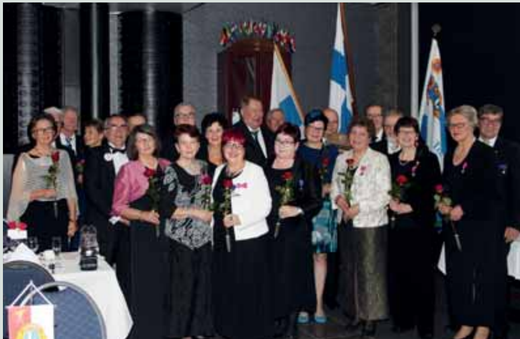
LC Torni/Pudas palkitsi suuren joukon ansioituneita jäseniään 40-vuotisjuhlassa.

LC Tornio/Pudas vietti 40-vuotisjuhliansa 15.10.2016. Juhlapäivän ohjelmaan sisältyi päivällä käynnit edesmenneiden klubin lioneiden haudoilla sekä tilaisuus paikallisten nuorten harrastajien muistamisen merkeissä yhteensä noin 5 000 euron stipendein.