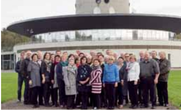
LC Köyliön 50-vuotisjuhlamatkalle osallistuneet Tallinnan TV-tornin juurella.