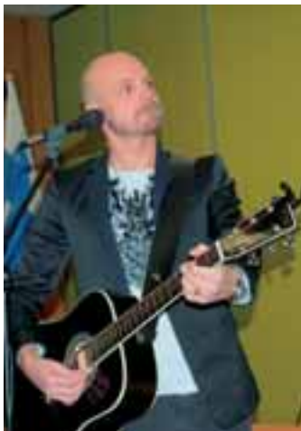
Vuoden valtakunnallinen Hyväntekijä 2016 laulaja-lauluntekijä Juha Tapio.

Suomen Lions-liitto jakaa vuosittain Hyvän Päivänä tunnustusta henki-