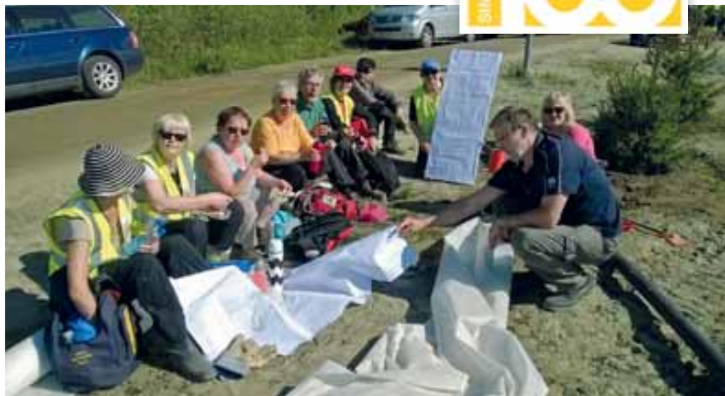
Välillä evästeltiin ja tutkittiin istutuskarttoja, jotta ruusut päätyvät oikeisiin kohtiin.

Kaupungin oma budjetti hankkeeseen on 110 000 euroa, jolla puistoon tehtiin pohjatyöt, käytävät ja nurmialueet. Ne veivät noin puolituisia vuotta. Klubeille jäi ruusu-