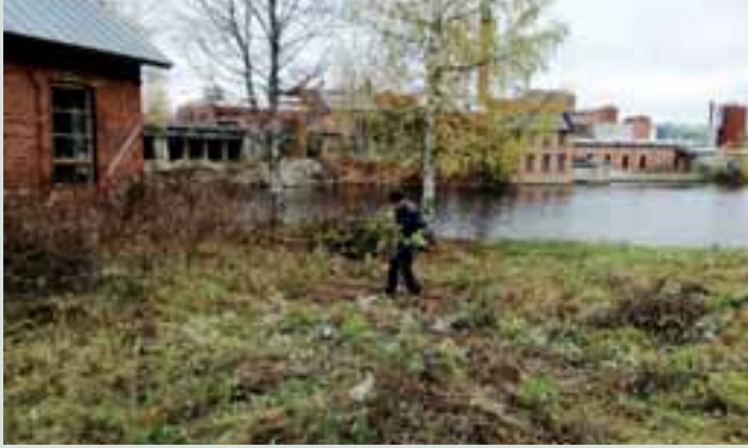
Historiallisesti arvokkaan Ruukkialueen raivaus kuului LC Juankosken Hyvän päivään 8.10.