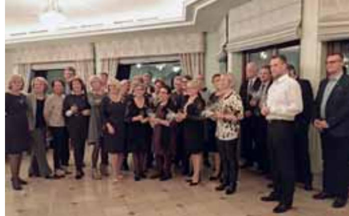
Ryhmäkuvassa LC Gdansk/ Amber ja LC Sastamala/Lindan lioneita puolisoineen juhlaillallisella.