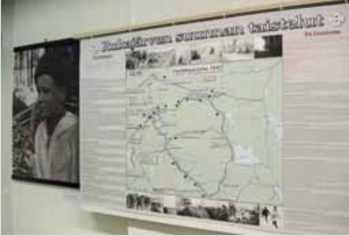
Karttakuva taistelualueista selvensi kuvaa Suomen kohtalonhetkistä.