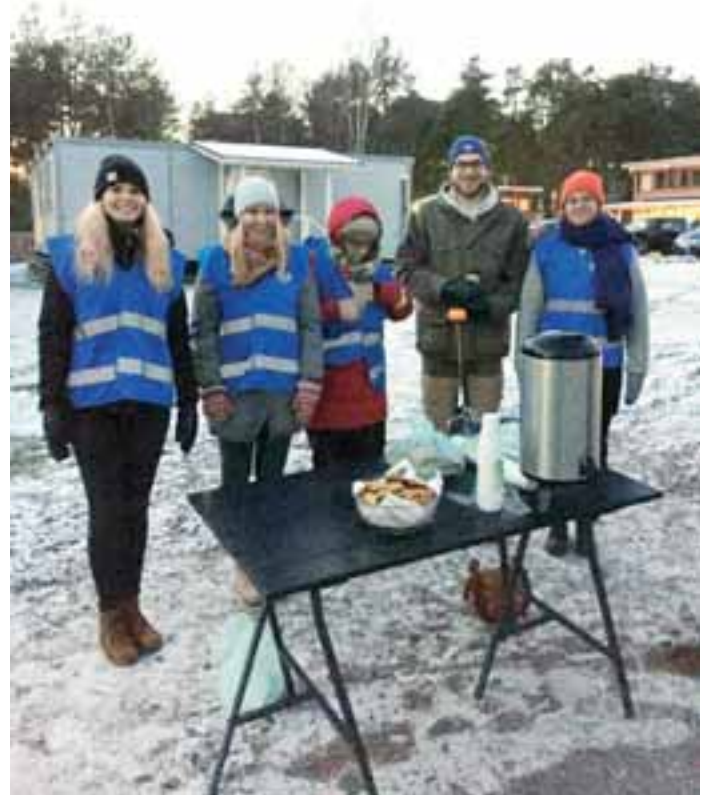
Leo Club Oulu/Kempele viettämässä Hyvänmielenpäivää.