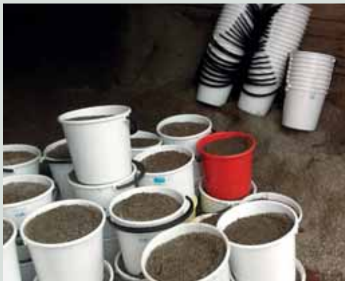
Hiekoitussepeä odottavat noutajaansa.

Tyhjän sangon voi laittaa portaalle tai kuistille näkyviin, jotta jakelijat voivat sen täyttää.