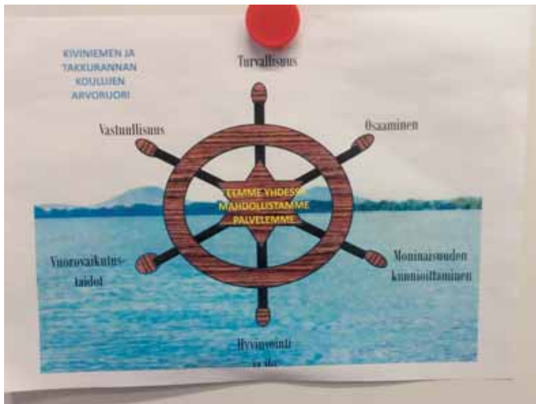
Kiviniemen koulun "arvoruori".

Seurasin kahden luokan oppituntia, jossa oppilaat pohtivat mitä turvallisuus, joka on yksi valittu koulun arvo, tarkoittaa heidän koulussaan. Menetelmänä Lions Quest -kurssin käyneet kaksi opettajaa käyttivät Lions Quest mukaista työryhmiin jakoa ja mielipiteen annoin peukuttamalla. Luokan oppilaat jaettiin viiden oppilaan ryhmiin ja jokaiseen