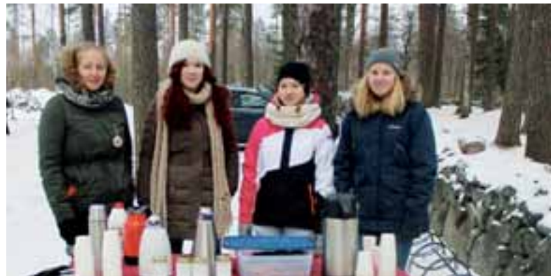
Järvenpäässä järjestimme Hyvänmielenpäivän pyhäinpäivänä Järvenpään hautausmaalla, jossa olimme jakamassa pipareita ja lämmintä mehua. Ihmiset ilahtuivat lämpimästä mehusta viileänä pakkaspäivänä, mutta kyllä lämmin mehu maittoi leoillekkin pakkasen nipistellessä varpaita.

All Saints' Day, 5th of November in Finland, Leo Clubs nationally organised Hyvänmielenpäivä – The day of a good atmosphere. Leo Club Oulu/Kempele was one of them. The idea is that the Leo Club goes to the cemetery, and serves cookies and hot juice in order to cherish people who come to cemetery to memorize their loved ones. This time of the year is usually quite cold, so people loved the fact that the juice was hot and the cookies self-made. The activitate was very easy to organize: all we needed was a table for the cookies and the juice, a thermos flask to keep the juice hot, and a candle to lighten up when the weather gets dark. Also, baking cookies (or actually gingerbreads) together with our club members was very fun thing to do. With a little things like this, we can make eveyone's days just a little bit better.