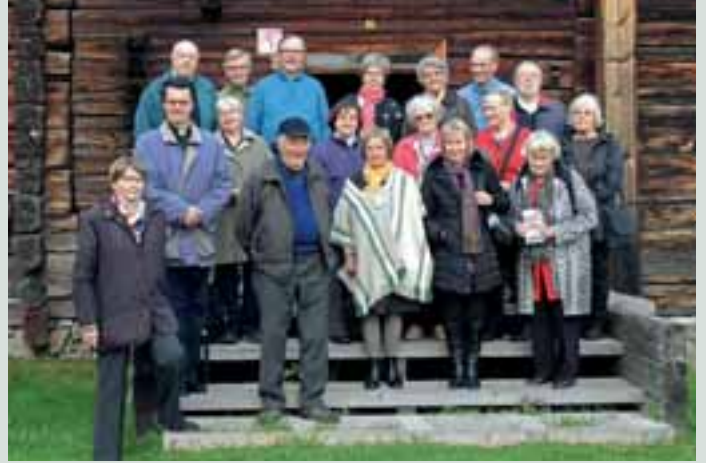
Klubin retkeläiset Lieksan kotiseutumuseon talonpoikaispirtin portailla.