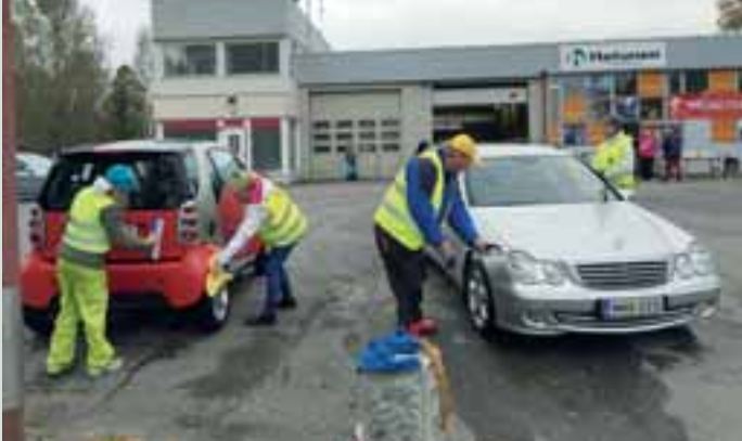
Innokaat LC Hämeenlinna/Birgerin jäsenet pesemässä autoja Parolassa.