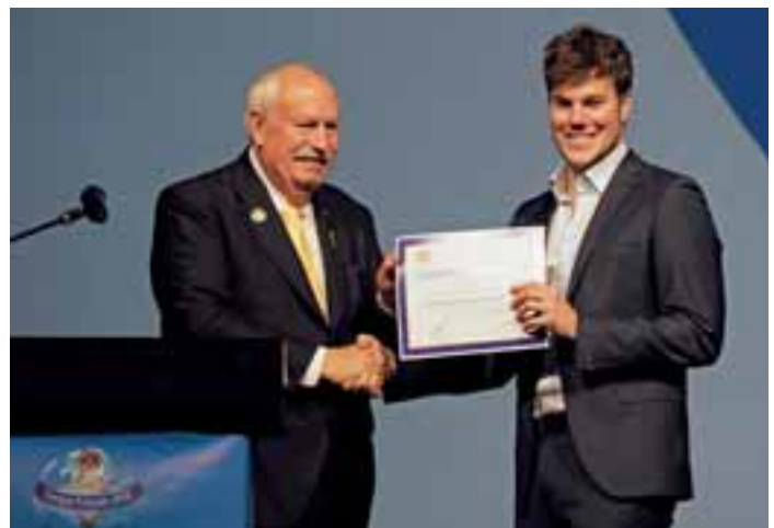
Musiikkikilpailun voittajalla on hymy herkässä.