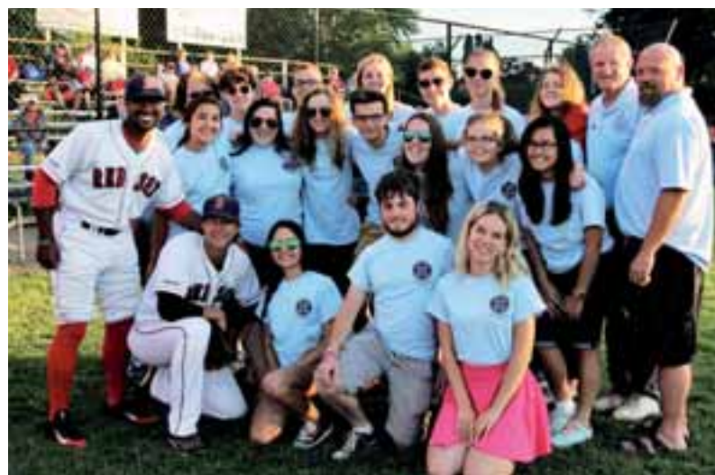
Ryhmämme katsomassa baseball-pleiä Brantfordissa.