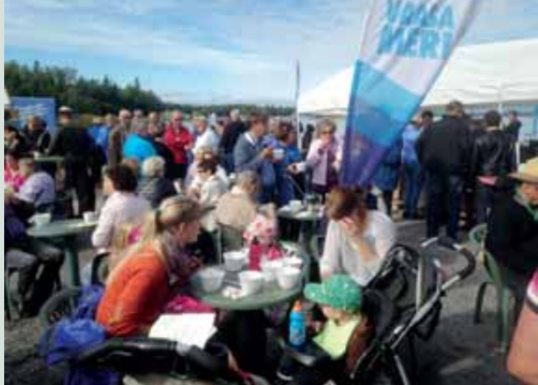
LC Vaasa/Meri klubin vuotuinen suur tapahtuma on vetänyt kansaa koolle neljännesvuosisadan ajan.