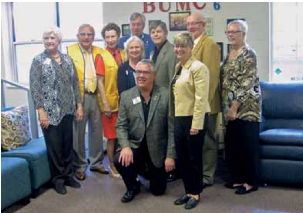
Synscreeningsgruppen i Brentwood United Methodist-kyrkans daghem.

Det utnämndes koordinatörer för länderna i Östeuropa. Instruktionerna för tjänstemän på klubbnivå har uppdaterats.