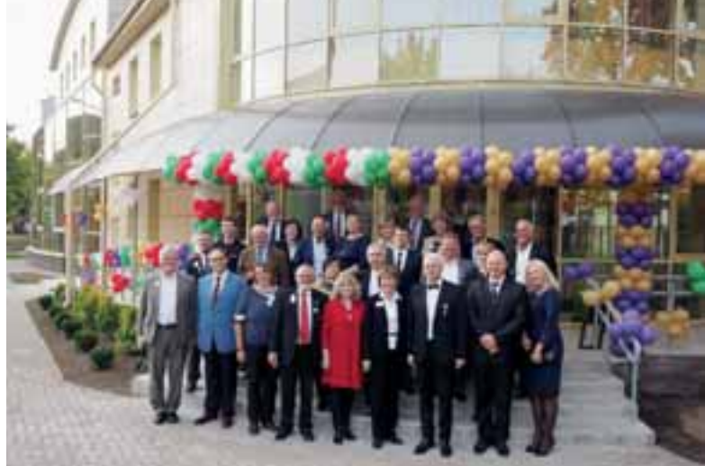
De internationella gästerna vid huvudingången till institutet.