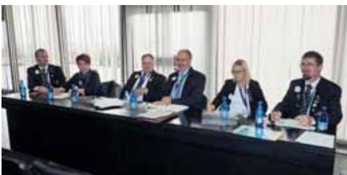
Pohjoismaisten puheenjohtajien kokous oli varsin sopuisa.