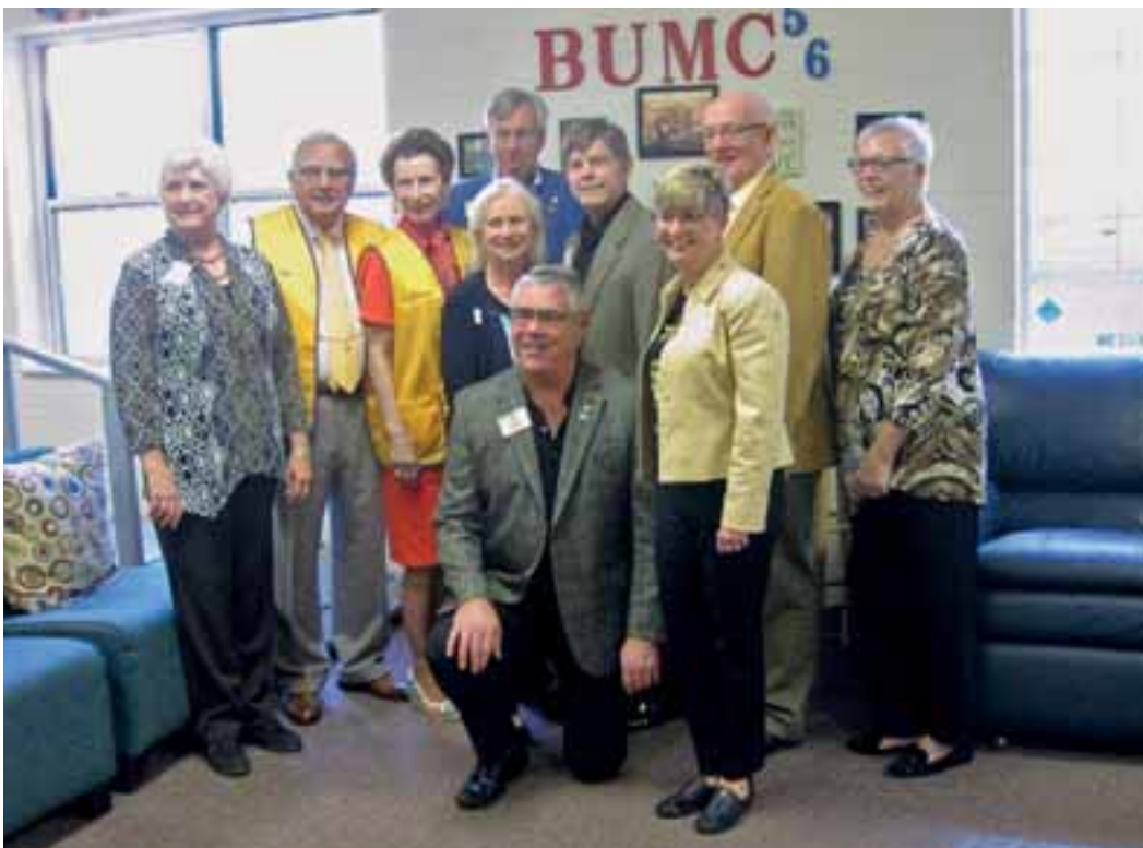
Näönseulontaryhmämme Brentwood United Methodist -kirkon päiväkodissa