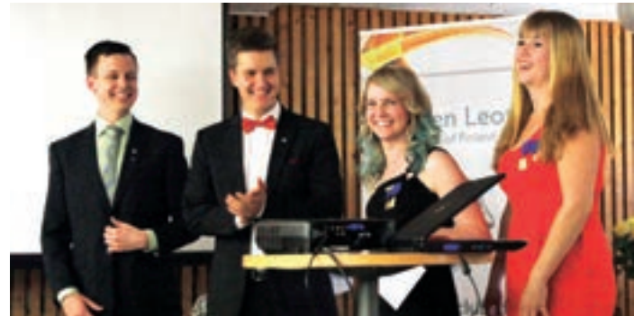
Vuoden aktiviteetti oli Leo Club Espoo/Downtownin reppulahjoitus.

voi tietää mitä seuraavaksi tapahtuu ja oletko tehnyt asiat oikein. Nämä selviävät vasta viimeisillä hetkillä. Lopputulos on hyvä, sen tiedät jo alusta alkaen. Mutta sen uskot vasta kun viimeinenkin kivi on käännetty. Nämä ajatukset ovat varmasti monelle tuttuja jonkin prosessin kuluessa. Nämä toteutuivat myös omalta osaltani tämän vuosikokouksen järjestelyiden kuluessa. Kun hetkittäin tunsin että painin asioiden kanssa yksin, muistin samalla miten toimimme tässä organisaatiossa: emme saa aikaiseksi yksin juuri mitään, mutta porukalla saavutamme aina jotain. Siihen kiteytyy leo- ja leijonaperhe kaikessa yksinkertaisuudessaan!