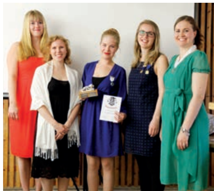
Vuoden leoklubiksi valittiin Leo Club Järvenpää.