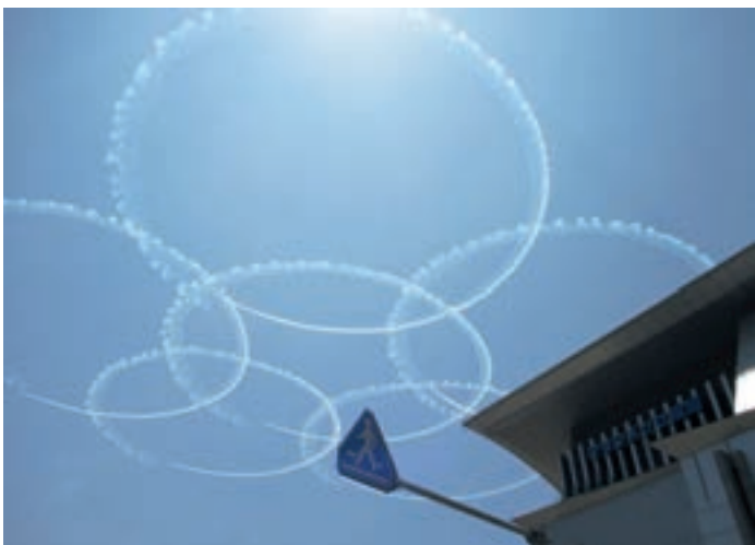
Japanin ilmavoimat kunnioittivat lionien juhlaa olympiarenkaiden muodossa.