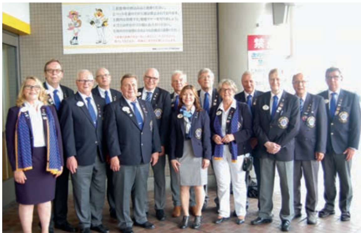
Uudet piirikuvernöörit ovat juuri vannoneet valansa Fukuokassa.

Listasimme suomalaisia palveluaktiiviteetteja: vanhainkotikäynnit, ros-