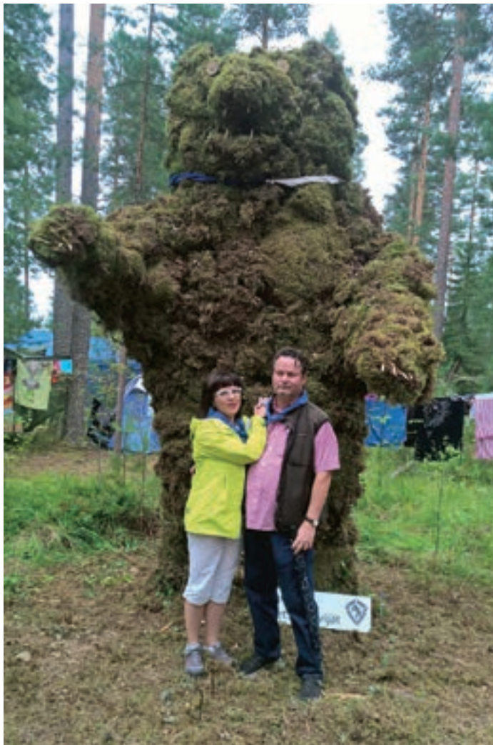
Som inbjuden gäst tillsammans med maken på scouternas storläger Roihu 2016 i Evois. Inte ens en stor björn kan hota två lejon!

försettningsvis: under den period som nu börjar utvecklar man en elektronisk undervisningsmiljö. Man förnyar materialet samt går vidare med utbildning riktad till idrottsföreningar. Vid sidan av utvecklingsarbetet på sikt är det ändå viktigt att se till att de kurser som är planerade för perioden kan förverkligas. Här har klubbarna en viktig roll. – Nog är väl er klubb med om att erbjuda redskap för fostrare inom ert eget område.