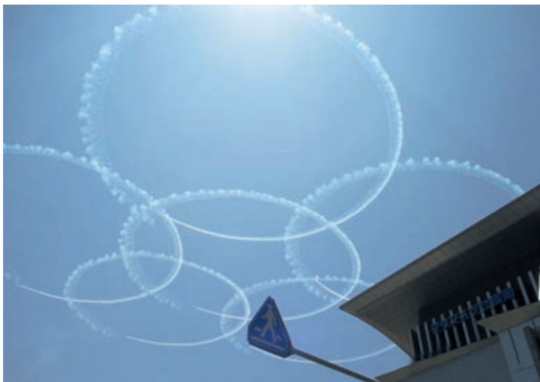
De japanska luftstridskrafterna hedrade lionens fest med de olympiska ringarna.