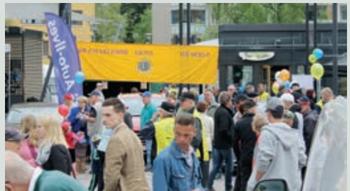
Kevään suuri autonäyttely keräsi Granitin aukiolle runsaasti väkeä.

Autonäyttelyn kuvia sivuillamme: http://e-clubhouse.org/sites/riihimaki_uramo/ sekä myös Facebook:ssa ”Suuri Autonäyttely”.