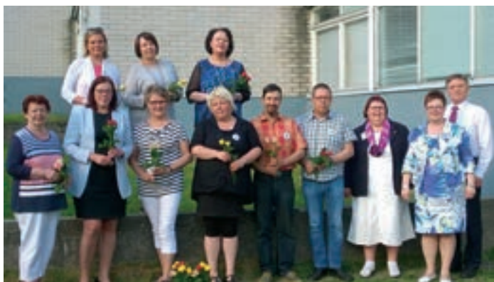
LC Nurmijärvi/Rockin perustajajäsenet.

https://www.facebook.com/LC-Nurmijärvi-Rock-1103148946417302/?fref=ts