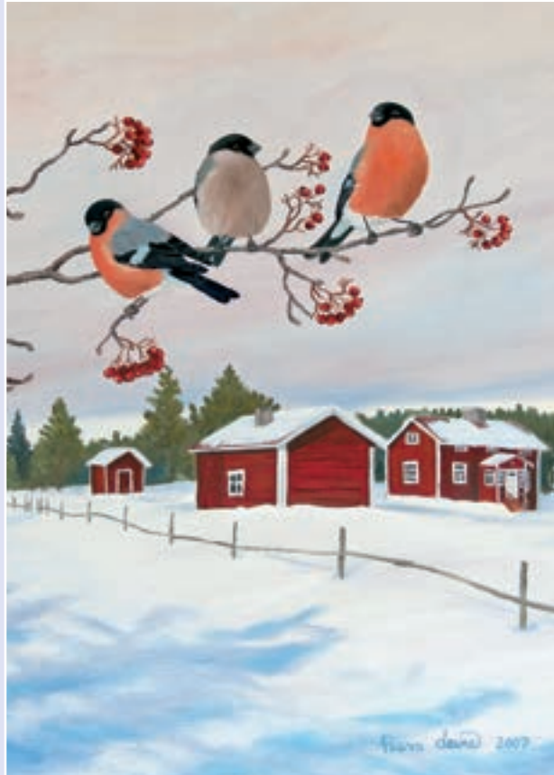
Punainen tupa Paavo Laine