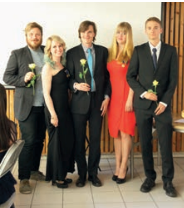
Kaudella 2015–2016 perustettiin kaksi uutta klubia, vasemmalla Leo Club Vantaa ja oikealla Leo Club Oulu/Kempela.