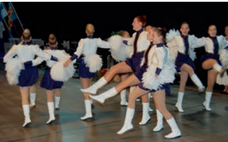
Vuosikokouksen ohjelman keventäjinä olivat suloiset Lahjan Paraatitytöt.

lionismia tarkoittaa enemmän palvelua. Tavoitteemme on lisätä lionismia määrää jokaisessa lionsklubissa.