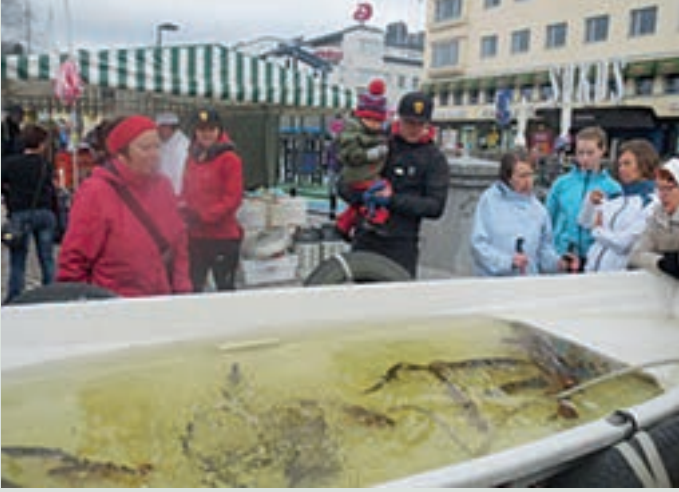
Kalojen paino kiinnosti kaikenikäisiä Mikkelin torilla.