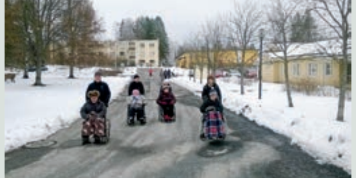
LC Pirkkala/Naistenmatkan lionit ja seuralaiset ulkoiluttamassa Pirkkalan Palvelukeskuksen asukkaita.

Merkkivuottaan Naistenmatkan leijonat juhlistivat lahjoittamalla Pirkkalan Vapaa-aikakeskukseen defibrillaattorin ja senioritalolle pianon. Lisäksi klubi ja seuralaiset tukivat vähävaraisia lapsiperheitä Hope-organisaation kautta yli 2 000 eurolla ja Särkänniemen elämysrannekeilla.