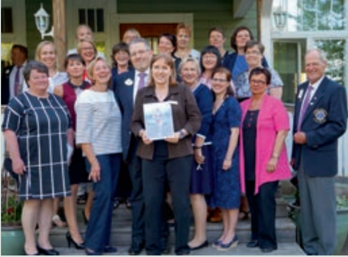
Dorikset ja opasleijonat yhteisessä kuvassa.