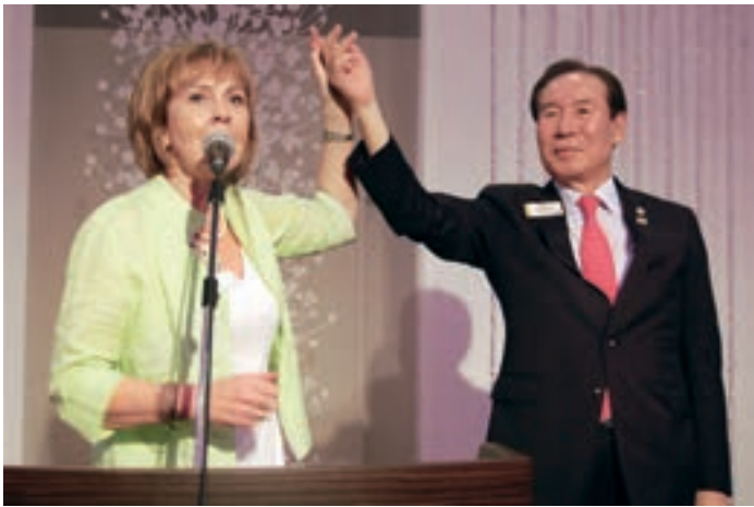
Kolmas varapresidentti Jung-Yul Choi nostaa kakkosvaran Guðrún Yngvadóttirin käden ilmaan kunnioittaakseen tulevaa naispresidenttiä.