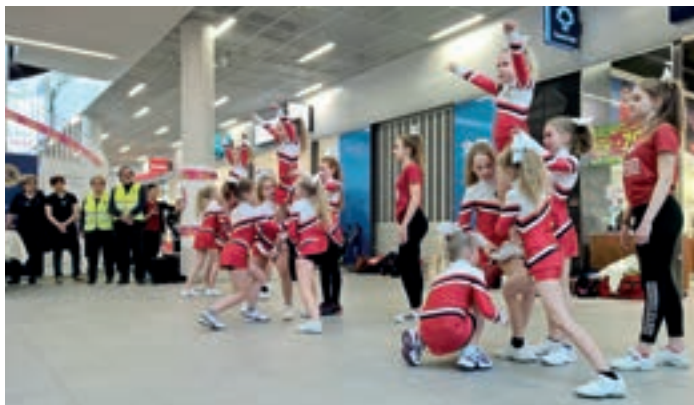
Hämeenlinna Huskies Cheerleadersin tytöt esittivät tanssillisen numeronsa, jossa nähtiin akrobatiaa, hyppyjä ja nostoja.