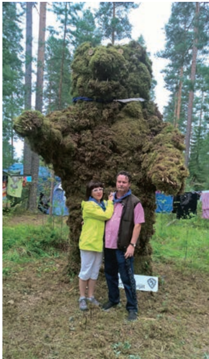
Partiolaisten kutsuvieraana tutustumassa Roihu 2016 -suurleiriin Evolla yhdessä puolison kanssa. Suurikaan karhu ei voi kahta leijonaa uhata! Kuvan otti yksi isännistämme.

Suomeen vuonna 1989 rantautunut Elämisentaitoja-koulutus juhlii 25-vuotista taivaltaan lasten ja nuorten hyvinvointiin tähtäävän työn parissa. Vuosien varrella koulutus on kasvanut huumeidenvastaisesta koulutuksesta laajaksi lasten ja nuorten elämisen taitoja ja tervettä kasvua tukevaksi kokonaisuudeksi. Paljon on siis tapahtunut