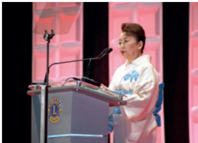
Den japanska kejsarliga familjens prinsessa Tomohito av Mikasa besökte årskongressen.