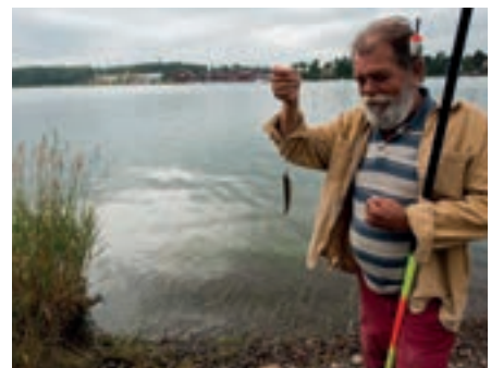
Ahvensaalis, lähes 30, riittää luonaaksi