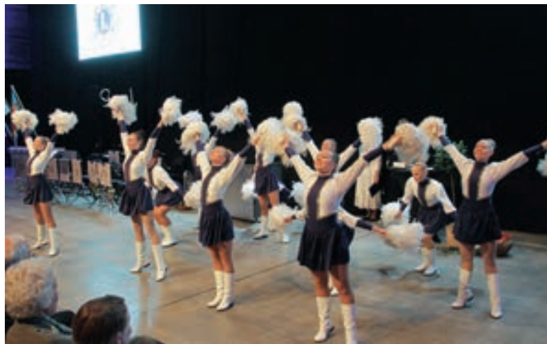
Årsmötets program lättades upp av de förtjusande Lahjan Paraatityöt.

Årsmötet godkände enhälligt verksamhetsberättelsen för perioden 2014–2015. Bokslutet för perioden 2014–2015 fastställdes och ansvarsfrihet beviljades de redovisningsskyldiga. Den internationella presidentens kampanj under senaste period "Ask One" lyckades utmärkt. Man fick flera nya medlemmar än under de tre föregående perioderna men även avgångar skedde i motsvarande grad. Man grundade sex nya klubbar vilket var mindre än vad man satt som mål. Nio klubbar upphörde med sin verksamhet. Trots att medlemsantalet gick ner var medlemsutvecklingen i Finland den bästa i Norden och i Europa kom Finland på femte plats, minus 0,70 %.