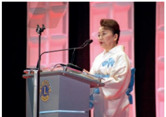
Japanin kuninkaallisen perheen prinsessa Tomohito of Mikasa vieraili vuosikongressissa.