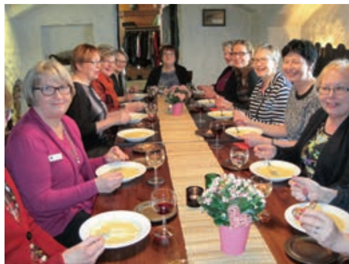
Komeettoja ja Liinuja yhteisellä aterialla.