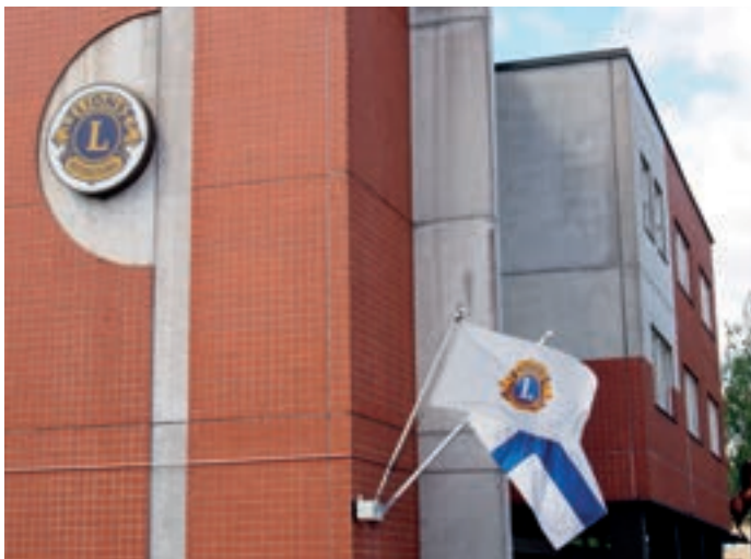
Euroopan ensimmäisen Leijona-talon rakentamisesta tehtiin päätös kesäkuun alussa 1986, talo rakennettiin kaudella 1986–1987 ja talo vihittiin käyttöönsä kesäkuun alussa 1987.

Harjannostajaiset pidettiin 27.2.1987 ja talon piti olla valmis 18.5.1987. Valmistumisaikataulussa urakoitsija ei pysynyt, mutta Euroopan ensimmäisen Leijona-talon vihkiäiset pidettiin 2.6.1987. Vihkiäjänä oli LCI:n presidentti Sten Åkestam Ruotsista. Helsinginkäynnillään hän