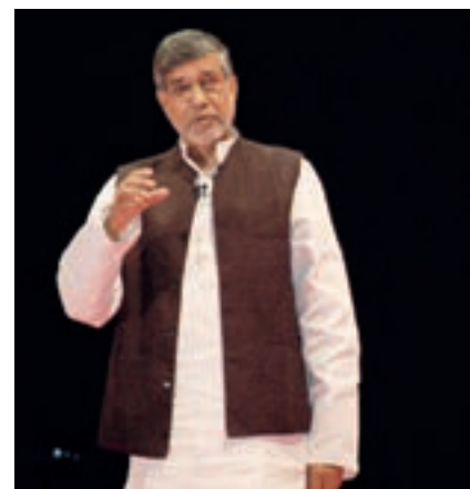
Kongressin kohokohtia oli Nobelpalkinnon voittaneen ihmisoikeusaktivistin Kailash Satyarthain puhe.