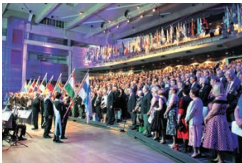
Som vanligt deltog representanter för andra lionsländer i Lionsförbundets årsmöte i Åbo. Här hälsar ländernas flaggor den talrika publiken vid årsmötets öppningsfest.

högt finns det alltid behov av förbättring. I själva verket finns det skäl till förbättring tills det för varje behov finns ett lion. För närvarande behövs varje lion och det betyder att det krävs att varje lion gör sitt bästa.