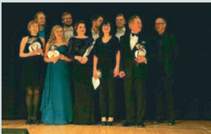
Kuvassa esiintyjät kukitettuina upean konsertin jälkeen.

Tämän "Hyvän mielen Leijona-konsertin" järjesti LC Siilinjärvi/Tarina. Lähes kaikki LC Tarinan leijonat ovat osallistuneet konsertti-ilämyksiin apuna järjestelyihin ja yhteisellä tekemisellä on huomattu olevan suuri merkitys klubin hyvän yhteishengen luomisessa. Konsertin tuotto ohjataan sekä Punainen Sulka -keräykseen että siilinjärveläisen lasten ja nuorten hyväksi.