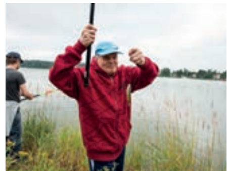
Kalaonni saa hymyn huulille