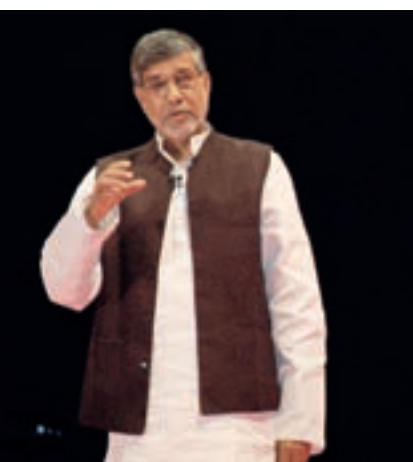
Kongressens höjdpunkt var Nobelpristagaren, människorättsaktivisten Kailash Satyarthains tal.