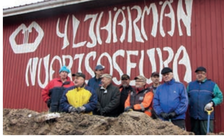
LC Ylihärman iloinen talkooporukka on kerännyt jo 415 prosenttia tavoitteeseen verrattuna.

Holmin mukaan klubissa tehdään paljon töitä nuorison hyväksi muutenkin. – Ei väliä onko kyseessä 4H- tai joku muu yhdistys. Nuorison hyväksi tehtävä työ motivoi klubiamme. Vaikka olenkin myynyt paljon tauluja, niin korostan, ettei Punainen Sulka ole yhden miehen projekti. Klubin jäsenet ovat hyvin