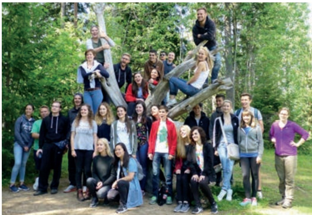
Illoiset leiriläiset yhteiskuvassa.

Sateinen heinäkuu muuttui poutaiseksi kuin taikaiskusta lauantaina 16.7. kun nuoret saapuivat Torpalle. Tulopäivä menikin tutustumisen ja leirisääntöjen merkeissä. Toisena leiripäivänä kisailtiin leiriolympialaisten merkeissä. Lajeina oli mm. lypsä, hiihtoa ja poron lassoamista. Iltapäivällä ohjelma jatkui käsitöiden merkeissä, vihtoja tehden ja leiripaitoja tuunaten. Illalla joulupukin vierailun jälkeen vihtoja testattiin ranta-saunassa. Maanantaina oli vuorossa Amazing race, seikkailu ympäri Tamperetta erilaisia tehtäviä suorittaen. Tiistaina nuoret valmistelivat ohjel-