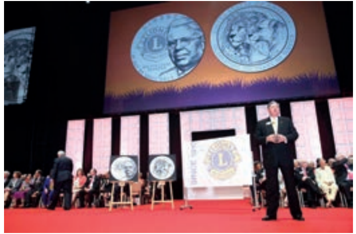
Fukuokassa julkistettiin Lions-järjestön 100-vuotisjuhlaraaha, hopeinen dollarin kolikko.