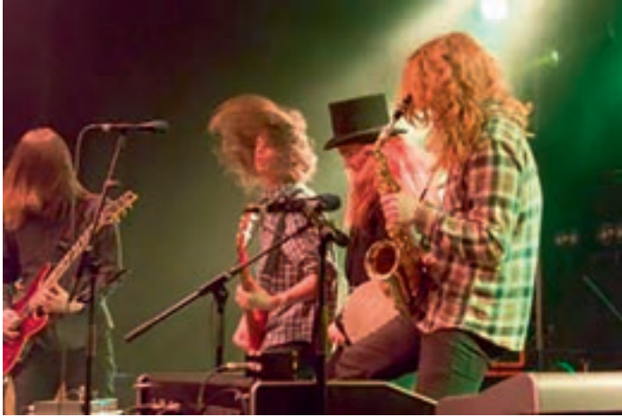
Soittamisen iloa parhaimmillaan.

Seitsemäs SKEBA – Nuorten bändiskaba 2016 kisattiin perjantai-iltana 27.5.2016 Turussa Nuorten taide- ja toimintatalo Vimmassa. Skabaan ilmoittautui 27 bändiä eri puolilta Suomea ja käytyjen piirikarsintojen jälkeen kuusi parasta bändiä kutsuttiin Turun finaaliin.