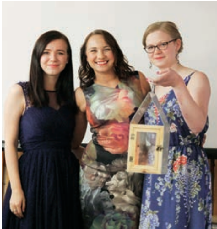
Lyhtypalkinto annettiin Leo Club Helsinki/Itäväylälle.