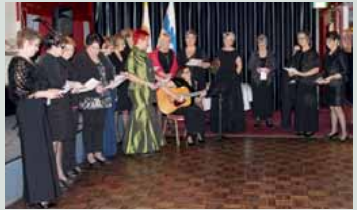
Keisarinnat yllättivät perustamisjuhlan vieraat lauluesityksellä.

LC Kitee/Keisarinnan ensimmäisessä kuukausitapaamisessa oli virallisen ohjelman lisäksi rentoutus- ja hyvinvointitietä, jonka tarkoituksena oli tutustua toisiin klubilaisiin ja sitä kautta kasvattaa yhteishenkeä ja keskinäistä luottamusta.