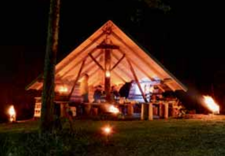
Lady-laavu roihujen valaisemana.