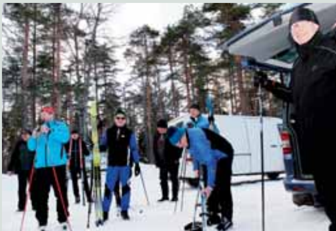
Leijonalauma ladulle lähdössä.