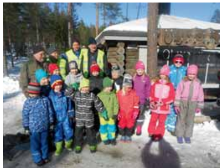
Lasten talviriehan osanottajat maltoivat pysähtyä hetkeksi yhteisen kuvan ottoajaksi.