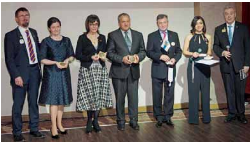
Järjestävien Pietarin klubien presidentit ja piirikubernööri saivat Suomen Lions-liiton terveiset.

Nykyisin Venäjällä on 21 lionsklubia, 15 Moskovassa, neljä Pietarissa sekä yksi Kaliningradissa ja Sahalinilla ja niissä jäseniä kaikkiaan n. 250. Leo-klubeja on nyt kaksi, Moskovassa ja Pietarissa. Venäjän Lions-klubit toimivat hyvin paljon lasten ja nuorten hyväksi. Toimittavat vaatteita ja ruokaa vähävaraisten lapsille, lahjoittavat pyörätuoleja, silmälasia ja kuulokojeita vammaisille ja instrumentteja heitä hoitaville laitoksille.