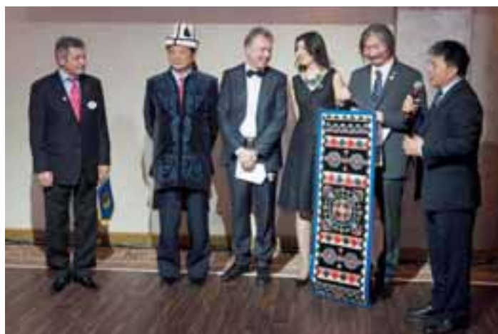
Idän eksotiikkaa edusti LC Bishkekin lähetystä Kirgiisiasta.