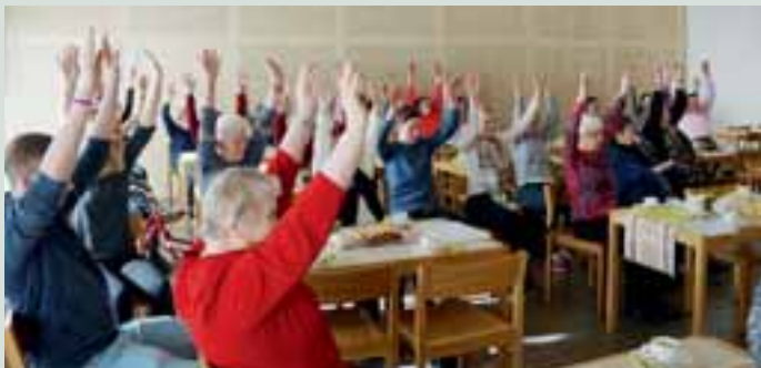
Ikäihmiset viettivät iloisen iltapäivän nuorten seurassa. Erilaista toimintaa riitti.