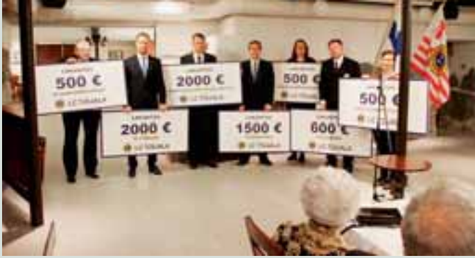
Lions Club Toijalan 60-vuotisjuhlassa jaettiin merkittävä summa lahjoituksina paikallisille toimijoille.