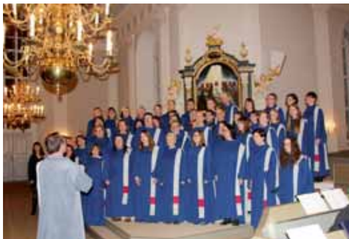
Bl.a. uppträdde kören Jacob Gospel vid årets Lionskonsert i Pedersöre kyrka.

Årets återkommande Lions välgörenhetskonsert inföll i år på vändagen den 14.2.2016. Konserten, som hölls i Pedersöre kyrka, ordnades av LC Jakobstad, LC Jakobstad/Malm, LC Pedersöre, LC Pietarsaari och LC Jakobstad-Pedersöre/Linnéor. Den var välbesökt med en nästan fullsatt kyrka och med mycket högklassig musik och sång av stadens egna förmågor. Intäkterna fördelades till Kvinnojouren och Pedersörenejdens kyrkliga samfällighet/Diakonin i Jakobstad och Pedersöre.