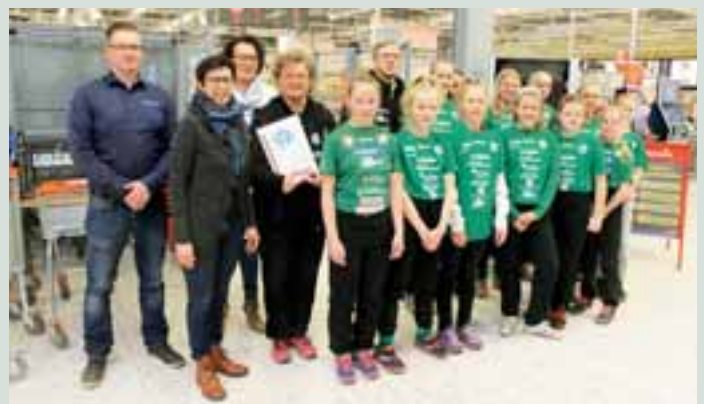
Lahjoittajat ja Visan tyttöjen jalkapallojoukkue.