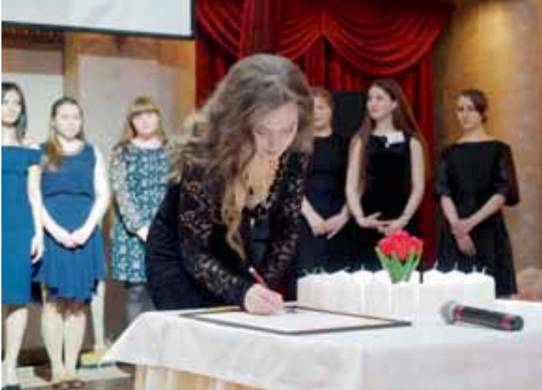
Leo Club St. Petersburg White Nights'in presidentti allekirjoittaa perustamiskirjan.