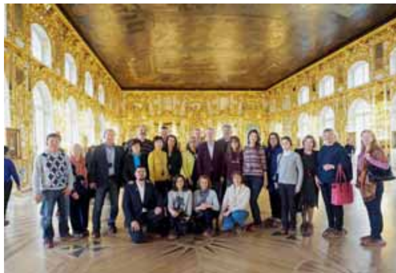
Ulkomaiset vieraat Katariinan palatsin suuressa salissa.

listuneet kansainväliseen nuorisovaihtoon. Osittain LCIF:n tuella on varustettu äänitysstudio näkövammaisten äänitteiden tuottamiseksi. Myös vanhukset ja veteraanit ovat avun saajina, niin materiaalsen kuin henkisenkin. Kauppakeskuksista on mm. kerätty ruokaa ja muita materiaalia meillekin tutulla "auta lasta, auta perhettä" -periaatteella.