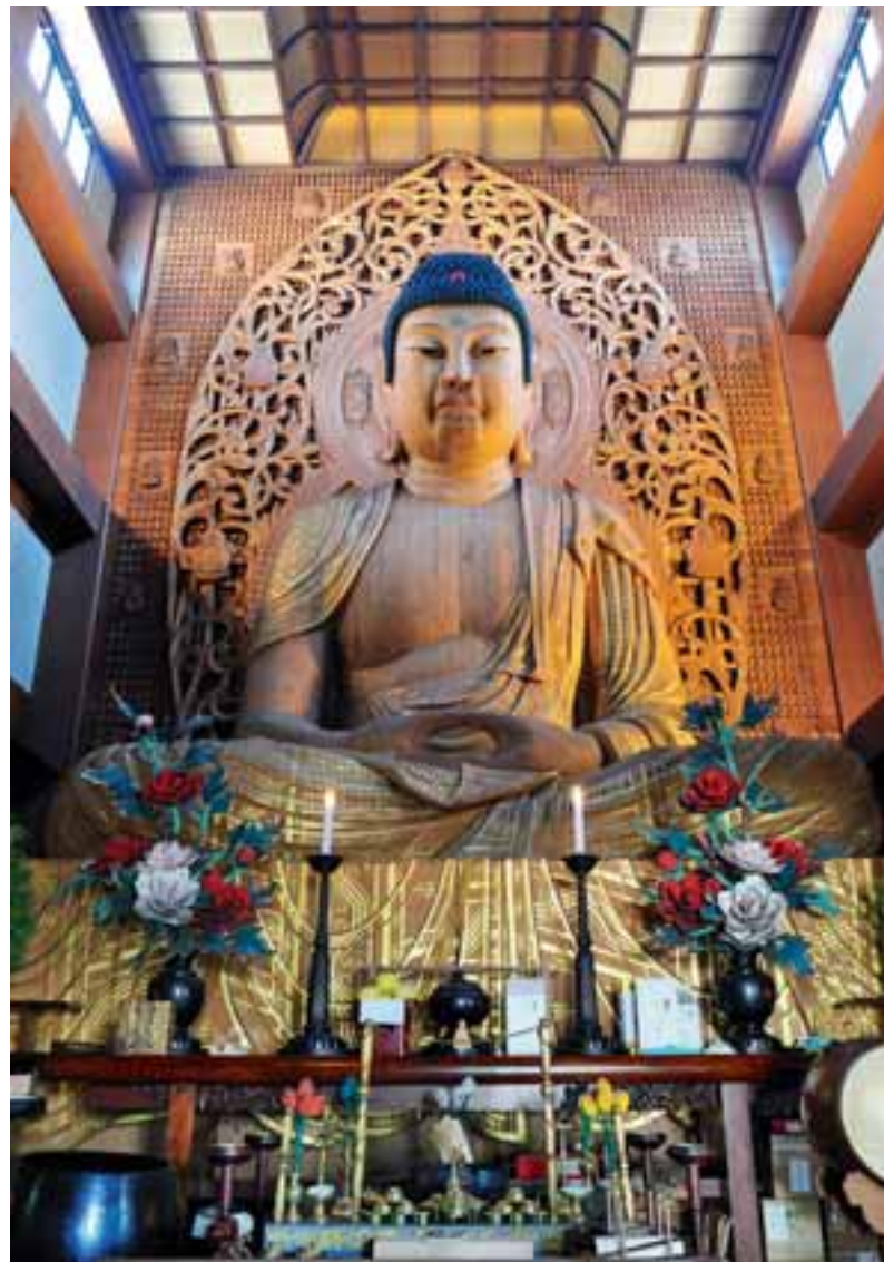
Fukuokassa sijaitseva Tochoji-temppeli on peräisin vuodelta 806. Istuvan Buddhan patsaan veistäminen alkoi vuonna 1988 ja kesti neljä vuotta.

Japanilaiset lionit eivät ole koskaan valmistautumattomia eivätkä toimettomia vaan valmistelevat ahkerasti menestyksekkästä vuosikongressia. Japani on paikka, jossa lionismi on erityisen voimakasta. Japanilaiset lionit ovat aina ensimmäisten joukossa reagoimassa mihin tahansa eri puolilla maailmaa tapahtuvaan katastrofiin. Heidän palveluhankkeensa ovat luotettavia ja tehokkaita.