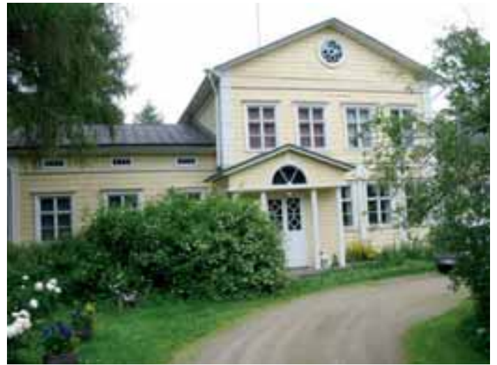
Hovin kartano Hauholla oli ensimmäisen Lions-nuorisovaihtoleirin pitopaikka.