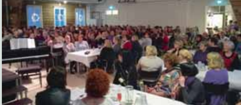
Kehruuhuone täyttyi naistenillan osanottajista.