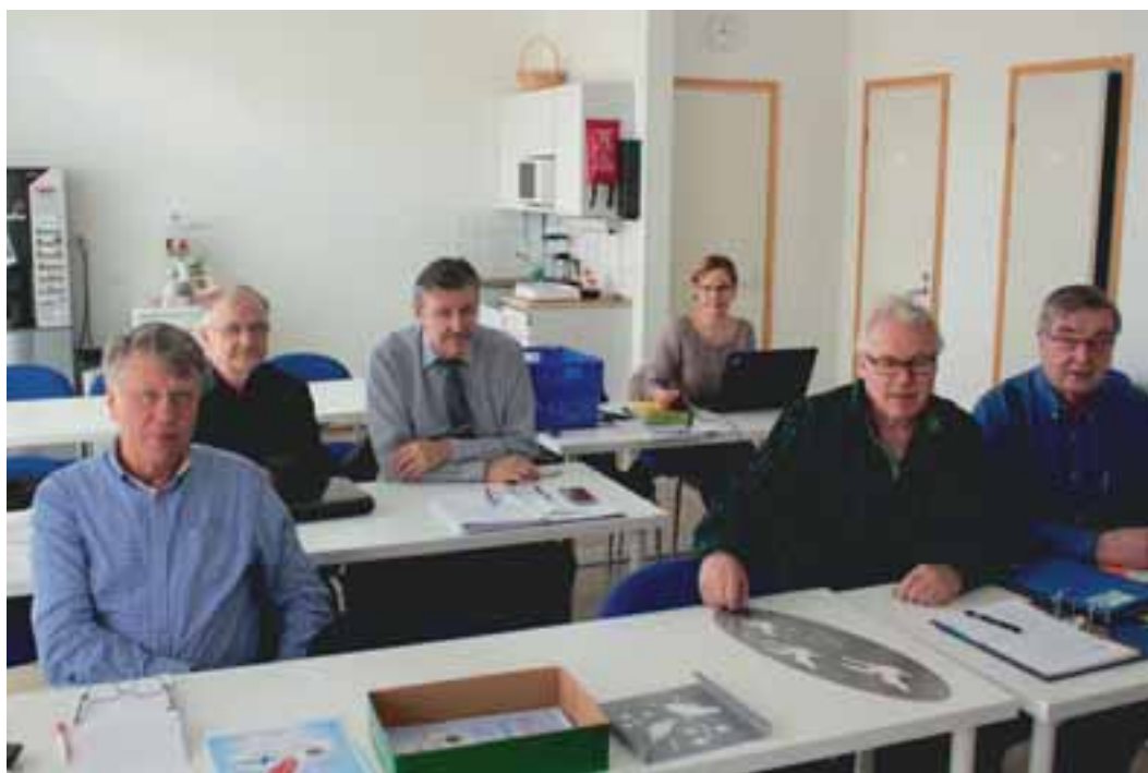
PuSu-kommittén vid mötet i april.