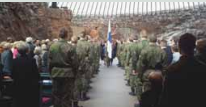
Liput saapuvat juhlavasti.