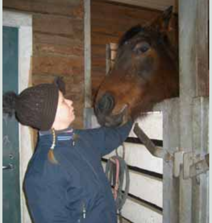
Jessica ja Flames vaihtavat kuluneen viikon kuulumiset.