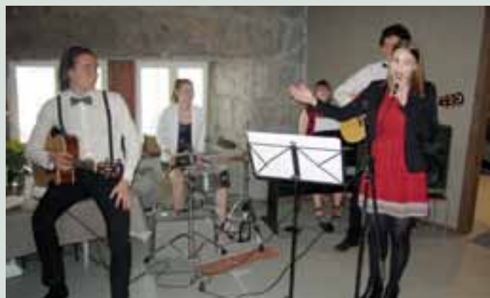
Juhlan musiikkipuolesta vastasi paikkakuntalainen yhtye, joka koostuu lionsperheistä lähtöisin olevista nuorista soittajista ja laulajista. Esitykset olivat raikas lisä juhlan ohjelmatarjontaan.

panjan keräykseen klubi osallistuu vähintään klubille asetettujen tavoitteiden täyttämiseksi eri menetelmiä käyttäen. Presidentti toivoi myös usia vastuunkantajia klubiin ja mielellään nuoremmista ikäluokista.