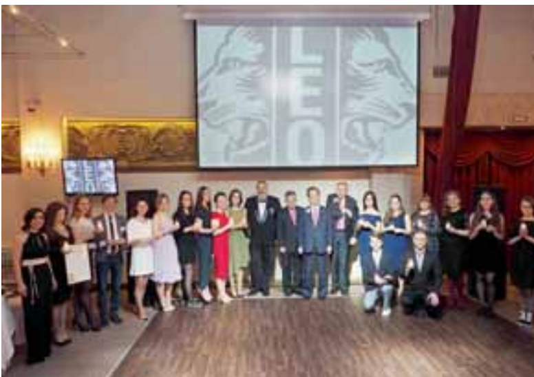
Uuden Leo-klubin jäsenet keskellään järjestön edustajat Romaniasta, Saksasta ja Japanista.

Erikoismaininnan ansaitsee Beslanin koulun 314 uhria vaatineen terroriuhokkayksen jälkihoito vuonna 2004. Lionit auttoivat niin henkisesti kuin fyysisesti vammautuneita henkiin jääneitä lapsia ja mm. lahjoittivat jälleenrakennetulle koululle huonekaluja ja tietokoneita. Klubit ovat tukeneet myös lahjakkaita lapsia heidän opinnoissaan sekä osal-