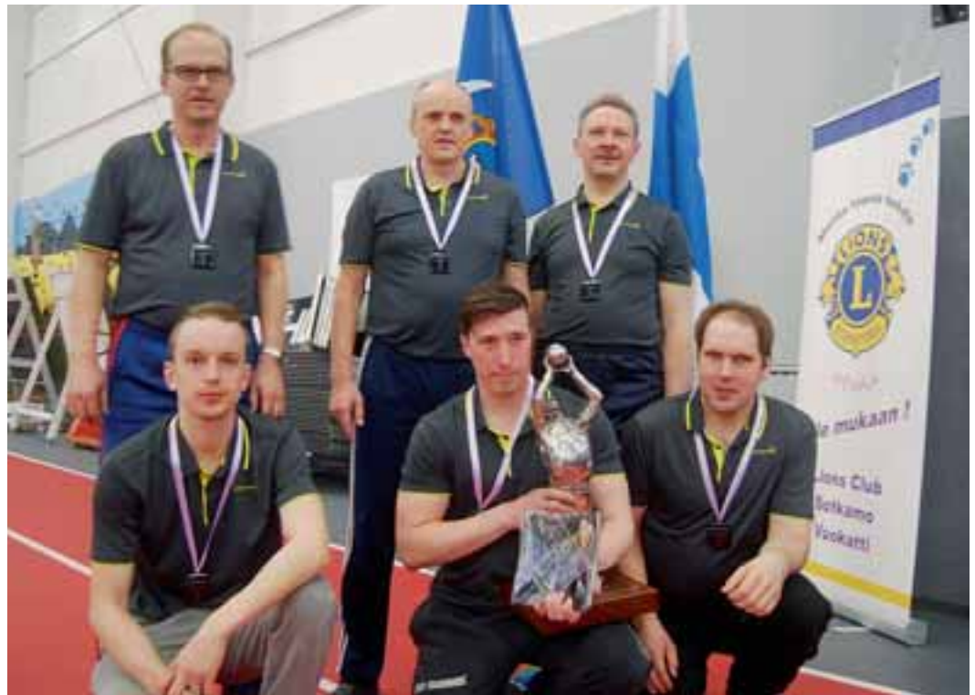
Leijonalentopallomestarijoukkue LC Ikaalinen/Kyrösjärvi ja voittopokaali.