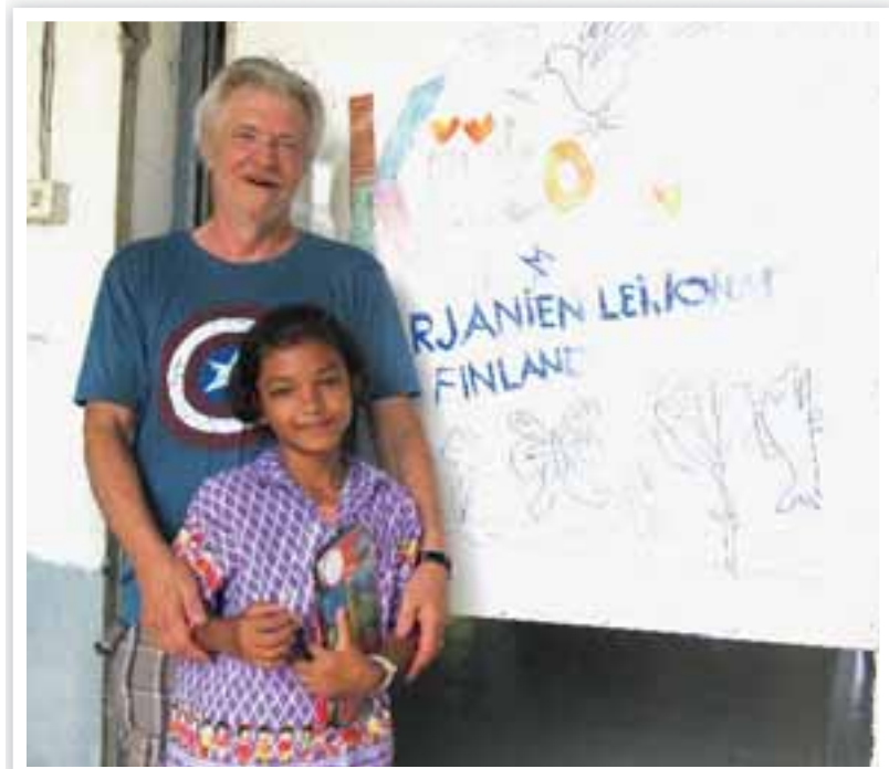
Kiitokset menivät myös Lions Club Helsinki/Marjaniemelle.