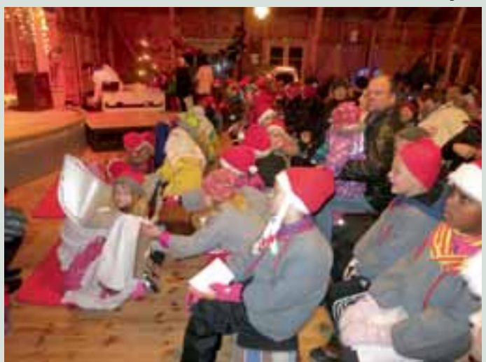
Nurmen lava tarjosi upeat ja tunnelmalliset puitteet tapahtumalle.