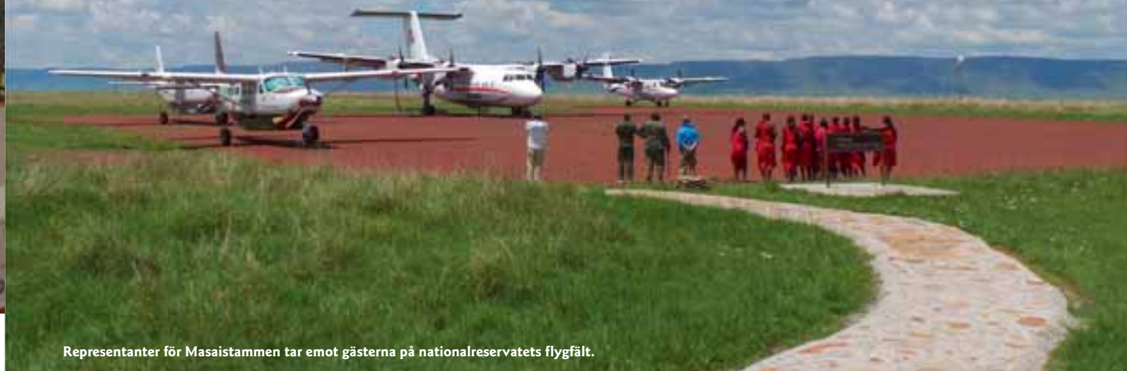
Representanter för Masaistammen tar emot gästerna på nationalreservatets flygfält.