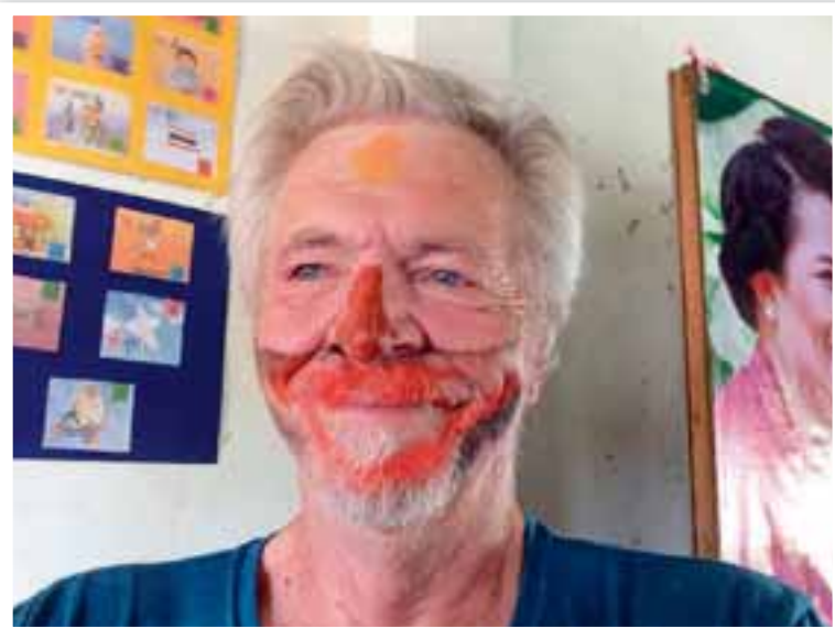
Kiitokseksi lapset kaunistivat myös opettajansa