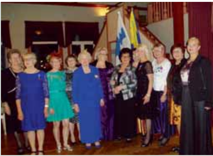
Linnattaria 20-vuotisjuhlassa.