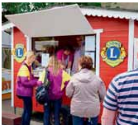
Pootorissa kahvi ja munkit tekivät kauppaansa.

Silakkamarkkinapaikkana palveli Kanalinrannan ja Rauman teatterin parkkipaikan alue. Lisäksi osa myyntipaikoista oli Kanalin toisella puolella Kanavakadulla. Silakkamarkkinapaikan keskipisteenä oli siten Rauman kanali, joka loi oikeaa tunnelmaa markkinoille.