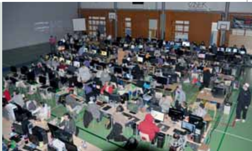
NoseLAN-tapahtumaan osallistui yli 200 henkeä. Tilaisuuden tuotto meni Nenäpäivä-keräykseen.