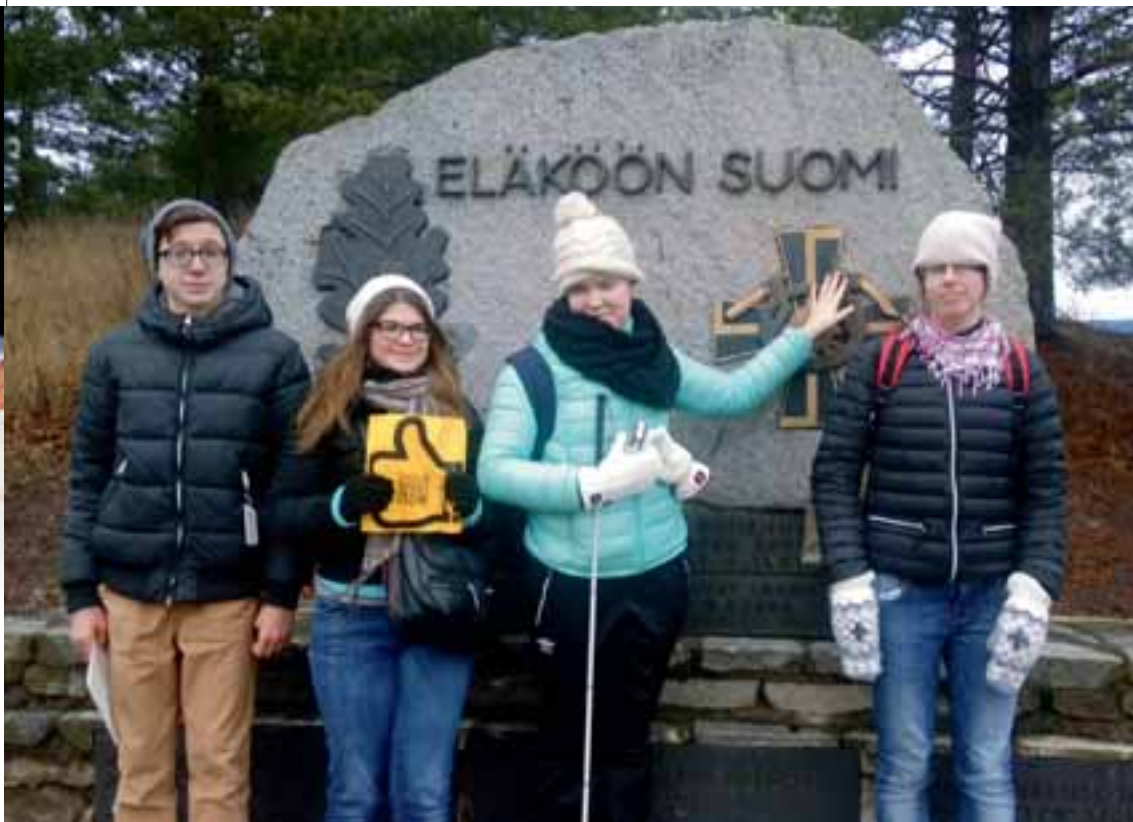
Kuva Lahdessa viime syksynä järjestetystä kaupunkisuunnittelutapahtumasta, jossa arvioitiin erilaisten kohteiden esteettömyyttä..