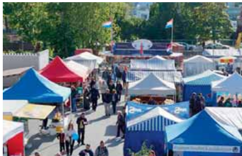
Silakkamarkkinoita suosi aurinkoinen sää, joka houkutteli markkinaväkeä liikkeelle.

Näin se lienee Suomen suurin yksittäisen klubin järjestämä Lions-tapahtuma.