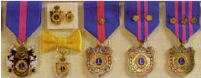
Mitalit ja merkit vasemmalta: Lion-Ritarin juhلامerkki, ylhäällä ritarin arkimerkit, alla puolisoimerkki, yhden-, kahden- ja kolmen ruusukkeen ansiomerkit.

Jäsenten palkitseminen kuuluu Lions-toimintaan. Kevätkausi on useissa klubeissa eri juhlien aikaa. Näissä tilanteissa on hyvä huomioida ansioituneita jäseniä. Palkitsemisen voi tehdä hakemalla jäsenelle säätin kunniakirjan, säätin pöytästandaarin tai säätin ansiomerkeistä: yhden ruusukkeen, kahden ruusukkeen tai kolmen ruusukkeen ansiomerkin.