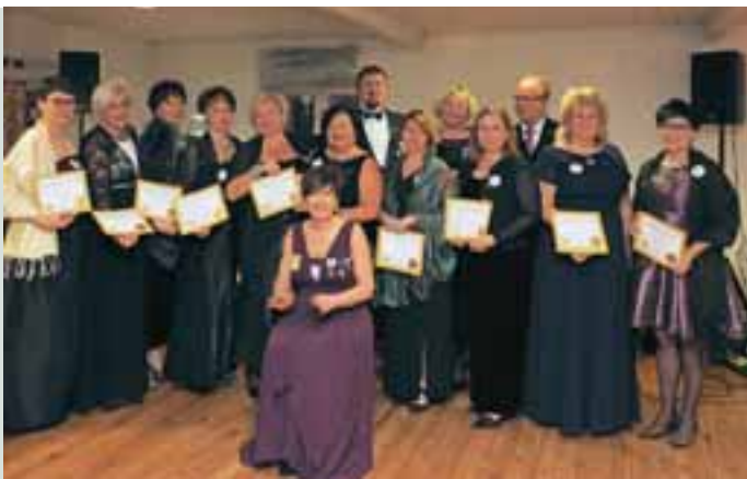
29 perustajajäsentä allekirjoitti nimensä perustamiskirjaan ja tässä on kokoonnuttu yhteiseen kuvaan.