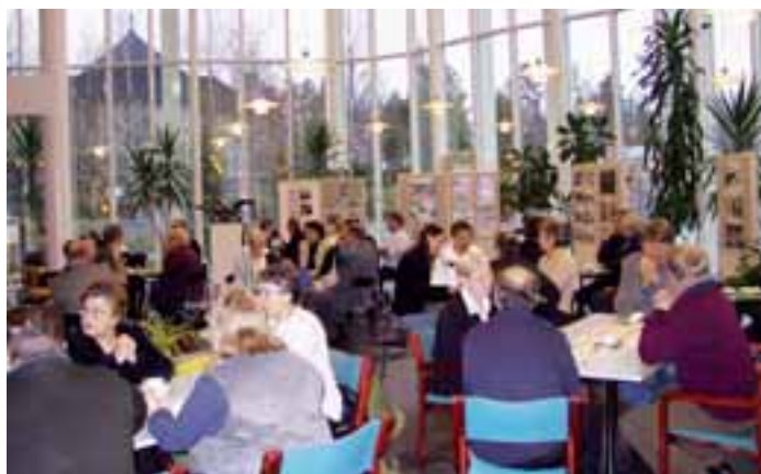
Uusia kuntalaisia LC Kangasniemen tarjoamilla aamukahveilla kunnantalon avarassa aulassa.