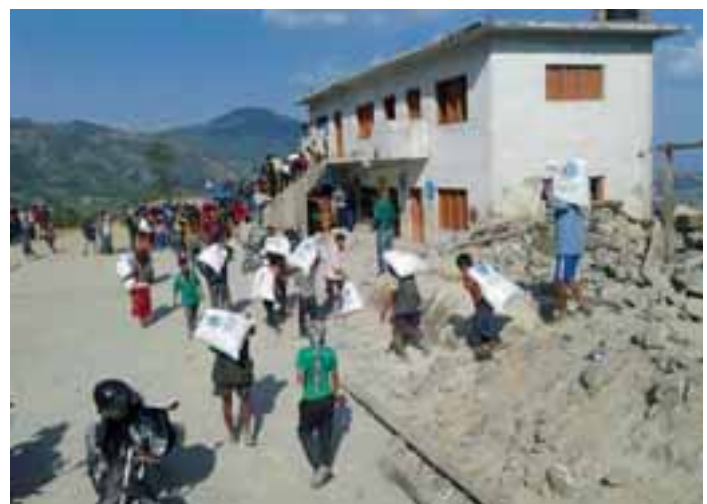
Kyläläiset kantavat lioneilta saamiaan hätäaputarvikkeita koteihinsa.

Kaiken kaikkiaan LCIF laitto liikkeelle yli 5 miljoonaa US dollaria sekä välittömään hätäapuun että pitkäkestoisiin jälleerakennustöihin. Nepalion lionit yhdessä LCIF:n kanssa ovat sitoutuneet jälleerakentamaan maan ja tulevat jatkamaan työtä, kunnes se saadaan valmiiksi.