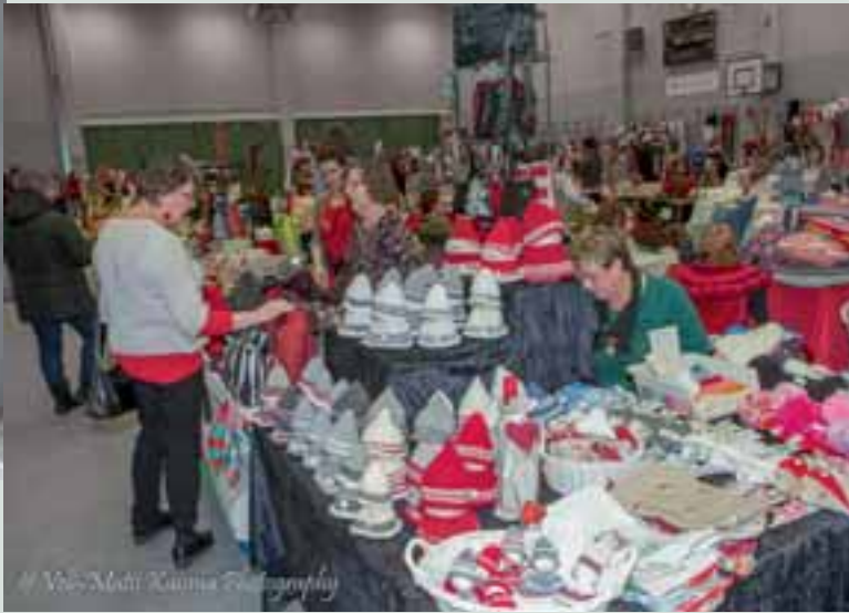
Urheilusalissa olevia myyntipaikkoja.

LC Vihti/ Hiidenveden ladyt ovat järjestäneet jo vuodesta 1986 joulun alla pidettävän myyjäistapahtuman, joka tunnetaan nimellä Naistenmessut.