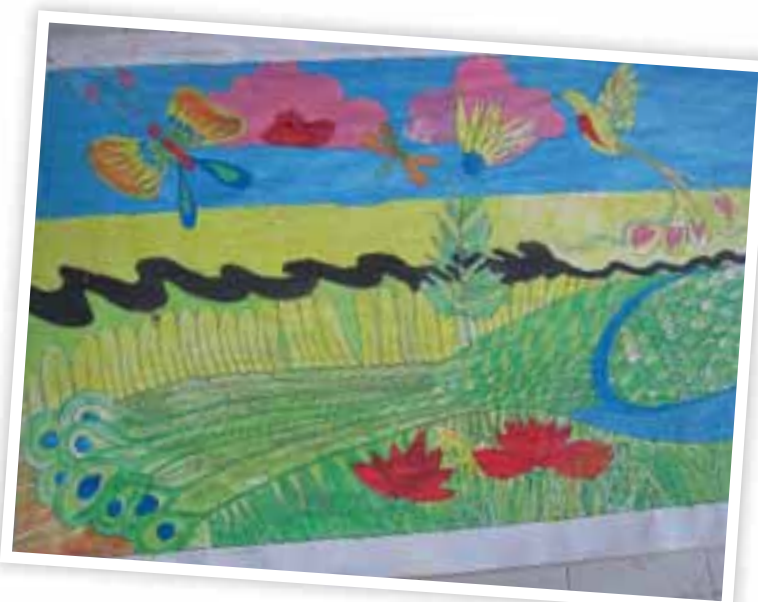
Taidepäivä alkoi Kari Ripatin piirtämän 3 m x 1,5 m kokoisen väritustehtävän maalaamisella. Näin tulivat vesivärien käytön perusalkeet esiin.

”Osana ohjelmaa on kunnianhimoisena tavoitteena myös rakentaa kehittämiskeskus, joka edustaisi viimeisintä suomalaista alan osaamista. Keskuksessa olisi noin 100 ihmistä vetävä ”Areena”, jossa voisi tehdä valistustyötä paikallisen väestön, erityisesti lasten vanhempien ja maanviljelijöiden keskuudessa. Ilman valistusta muutoksen tekeminen on mahdotonta, kuten hyvin tiedämme. Tavoitteena on mm. saada vanhemmat nykyistä paremmin tukemaan lastensa oppimiskehitystä. Areenassa voisi myös