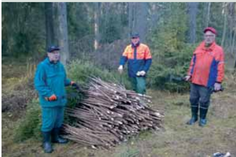
Parin tunnin auraskeppisaalis ja tekijät Ahveniston olympiamaisemissa.

Kyllä, luit aivan oikein. Hämeenlinnan kantakaupungissa ja maaseudulla on jo pari vuotta ajeltu ja kävelty LC Hämeenlinna/Tawastin ”äijien” vuolemien auraskeppien viitoittamalla tiestöillä. Tämän talviturvallisuus aktiviteetin on mahdollistanut loistava yhteistyö Hämeenlinnan kaupungin kanssa. Kesällä v.2014, sovittiin raamit 4 000 kappaleen suuruisen auraskeppien teko urakalle. Alkusyksystä (v.2014) lähes 40 klubilaista kävi työryhmissä vuolemassa Aulangon maaston kuusikoista kuukaudessa auraskeppi urakan valmiiksi.