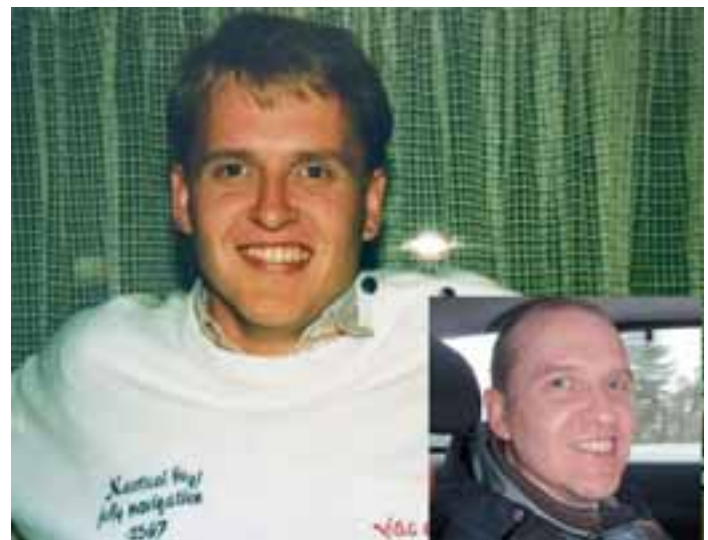
Leo Europa Forum 1992 Brysselissä, alakulmassa nykyiset tuntomerkit.

Ystävät houkuttelivat – myyntivalttina taisi olla että ”siellä on parhaat bileet” :-)