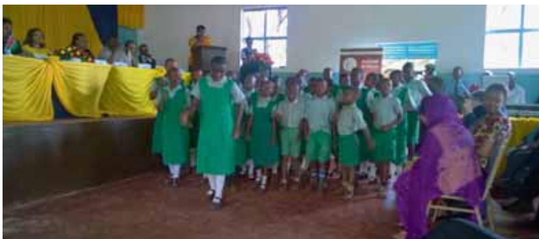
Barnen i Kaaniskolan sjunger för gästerna.