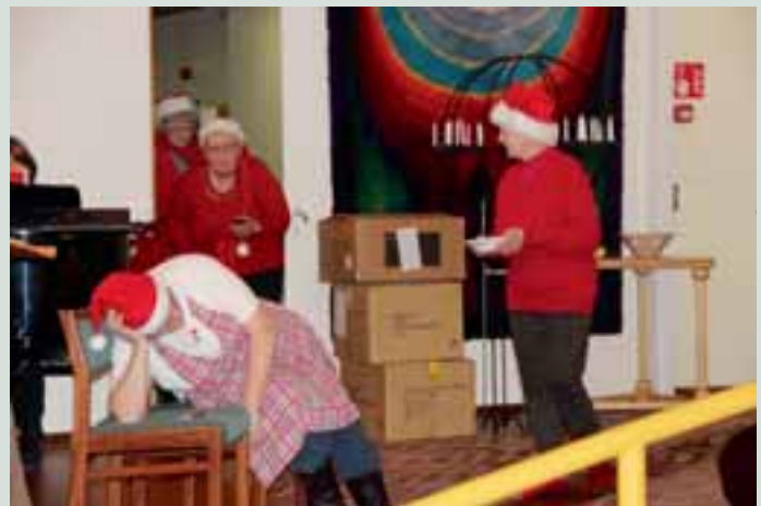
Näytelmistä vastasivat eläkeläiset.

Pieni mutta pippurinen LC Säyneisen porukka löi hanskat yhteen paikallisten järjestöjen kanssa. Säyneisen martat, EL Säyneinen sekä Säyneisen alueseurakunta, kutsuivat kaikki säyneiseläiset, entiset säyneiseläiset, ikäihmiset ja eläkeläiset yhteiseen Joulujuhlaan seurakuntasalille. Kydittömille järjestettiin kuljetukset. Kutsu meni hyvin perille, sillä paikalle saapui yli 130 henkilöä.