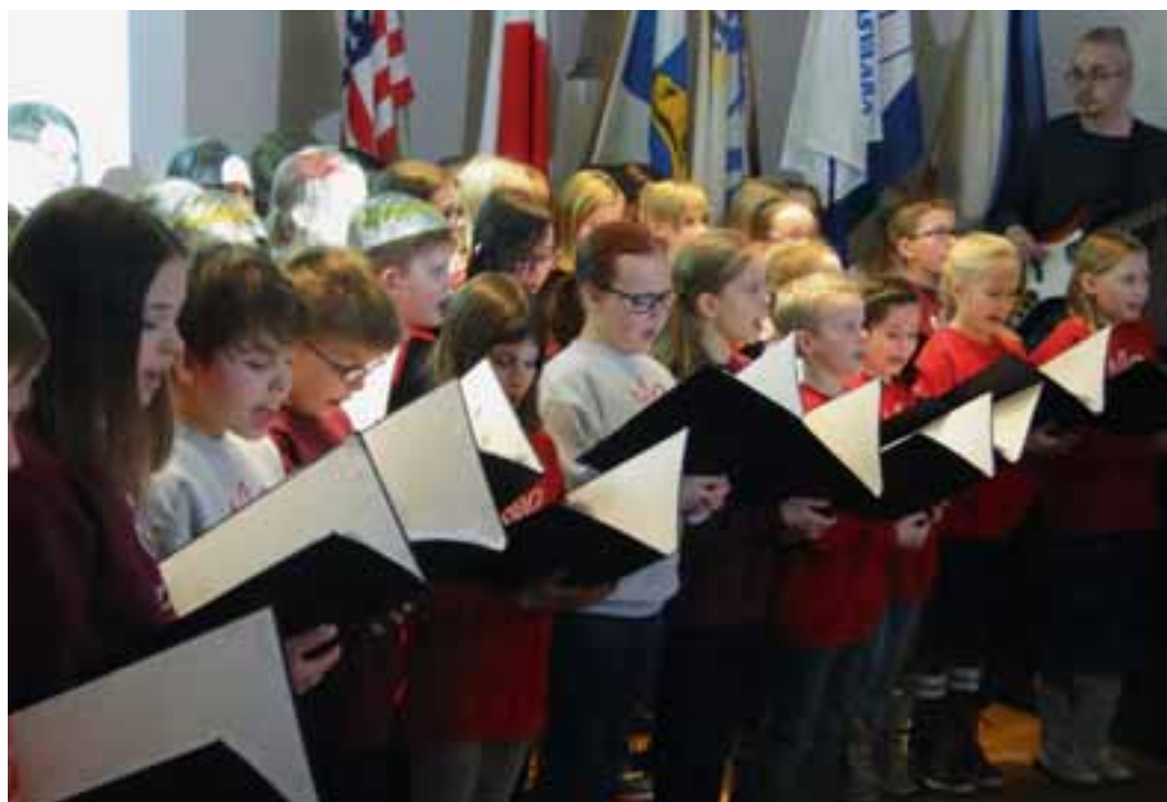
En inlevelsefull barnkör framförde med bravur de nordiska ländernas nationalsånger vid öppningsceremonin.

Nordiska samarbetsrådets möte (NSR) hölls i Rovaniemi 15–17.2016. Som arrangörer stod lionsklubbarna Rovaniemi/Lainas och Rovaniemi/Ounasvaara. Närmare 150 deltagare från alla nordiska länder samt Estland fanns på plats. I samband med NSR-mötet hölls ett antal utbildningstillfällen som gjorde att mötesveckoslutet samlade nära 200 lion och partner till Rovaniemi. Bl.a. hölls ALLI-utbildning (Advanced Lions Leadership Institute) med finsk-, svensk- och engelskspråkiga grupper med totalt 69 deltagare.