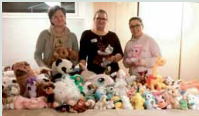
Mukava tietää, että näillä leluilla tuotiin iloa moniin Muhoslaisiin koteihin.

Syyspimeän saavuttua Muhokselle järjestettiin 300 henkilölle ilmainen,