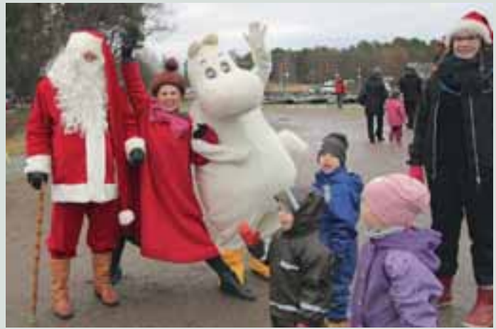
Lammasluodon Joulumetsä ja juhlavieraita.

Metsän kätköissä partiolaiset opastivat lapsia käden taidoissa ja yhdellä rastilla tehtiin arpakuutioita. Lapset seurasivat innolla arpakuution valmistu-