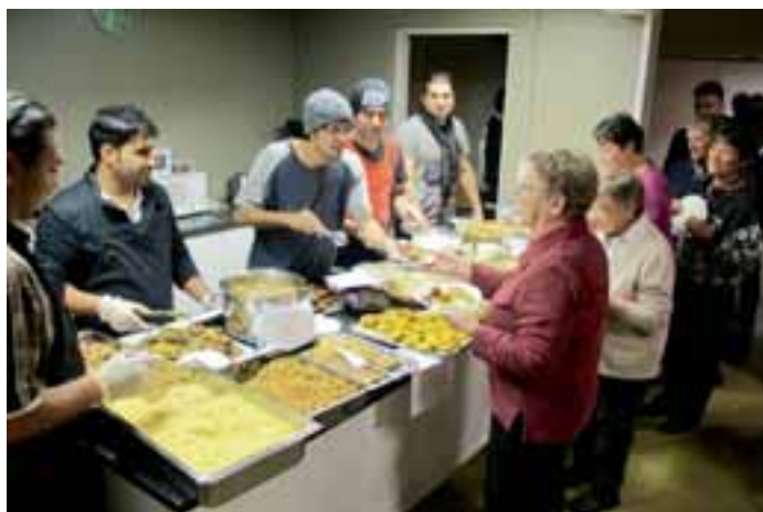
Bordet är dukat med irakisk mat och Jeppoborna fick nya smakupplevelser.

här processen. I oktober ordnade klubben en motionsdag till förmån för flyktingarna, där man vandrade längs det s.k. Trådi, en lokal vandringsled. I det strålande höstvädret trivdes också de nya invånarna, och man slog så att säga tre flugor i en smäll: LC Jeppo samlade medel för flyktingarna – senare omvandlade till bl.a. husgeråd och till råvaror för den irakiska aftonen – byborna kunde bekanta sig med de nyanlända, och alla fick frisk luft och välbehövlig motion.