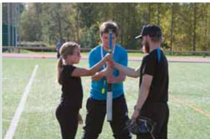
Jo hutunkeitossa e-tytöt määräsivät suunnan otteluun

Vajaan vuoden ikäinen rovaniemeläinen naisleijonaklubi oli hyvällä asialla jo kolmannen kerran. Vain kuukausi sitten Ronjat vierailivat Rovaniemen Nuorten Äitien pikkujouluissa vieden sinne mukanaan oikean Napapiirin Joulupukin sekä pussillisen lahjoja äideille sekä heidän pienokaisil-