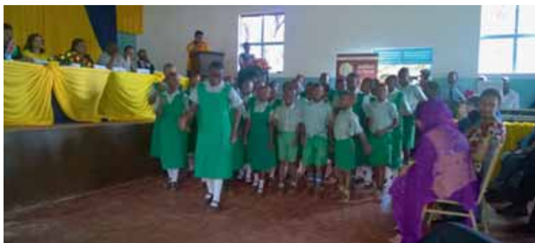
Kaani-koulun lapset laulavat vieraille.