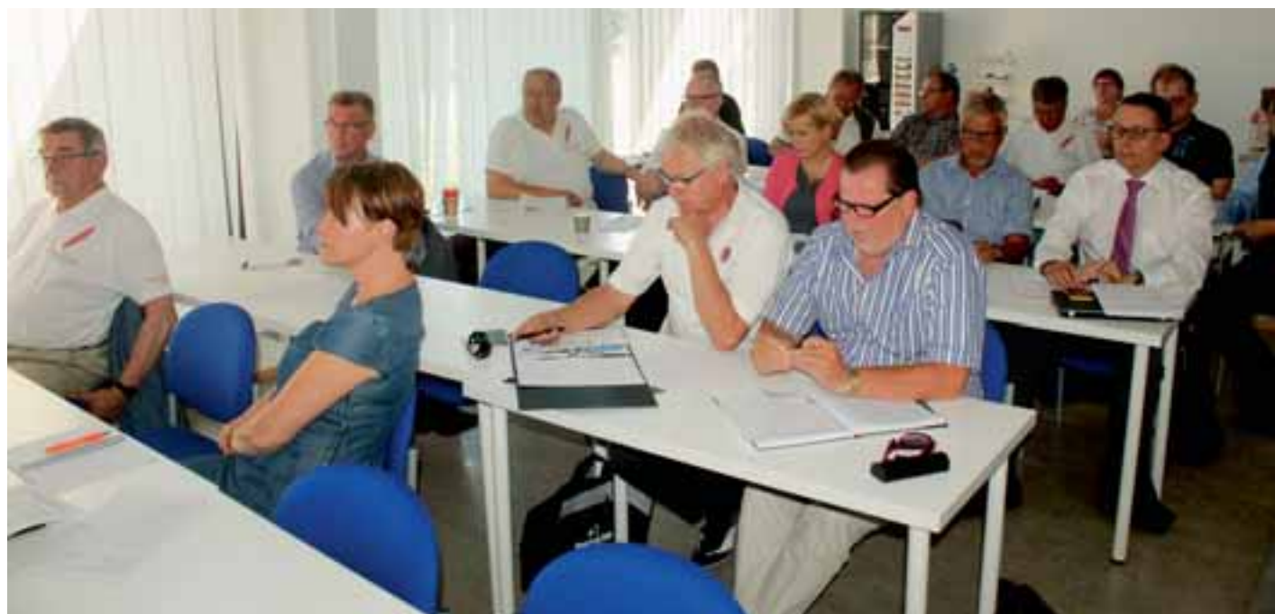
Distriktens Röda Fjädern -koordinatorer på skolbänken i augusti 2015.

Matti Tieksoala PDCC, LC Oulunsalo PuSu kommitténs ordförande