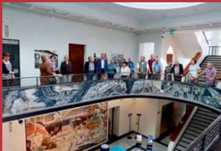
Serlachiusen työhönottaja piti meitä kovilla.