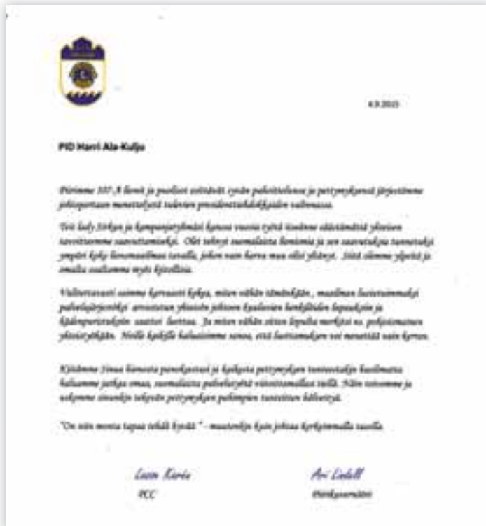
Lions-johdon päätöksestä on tullut paljon palautetta. A-piiri kommentoi asiaa näin.