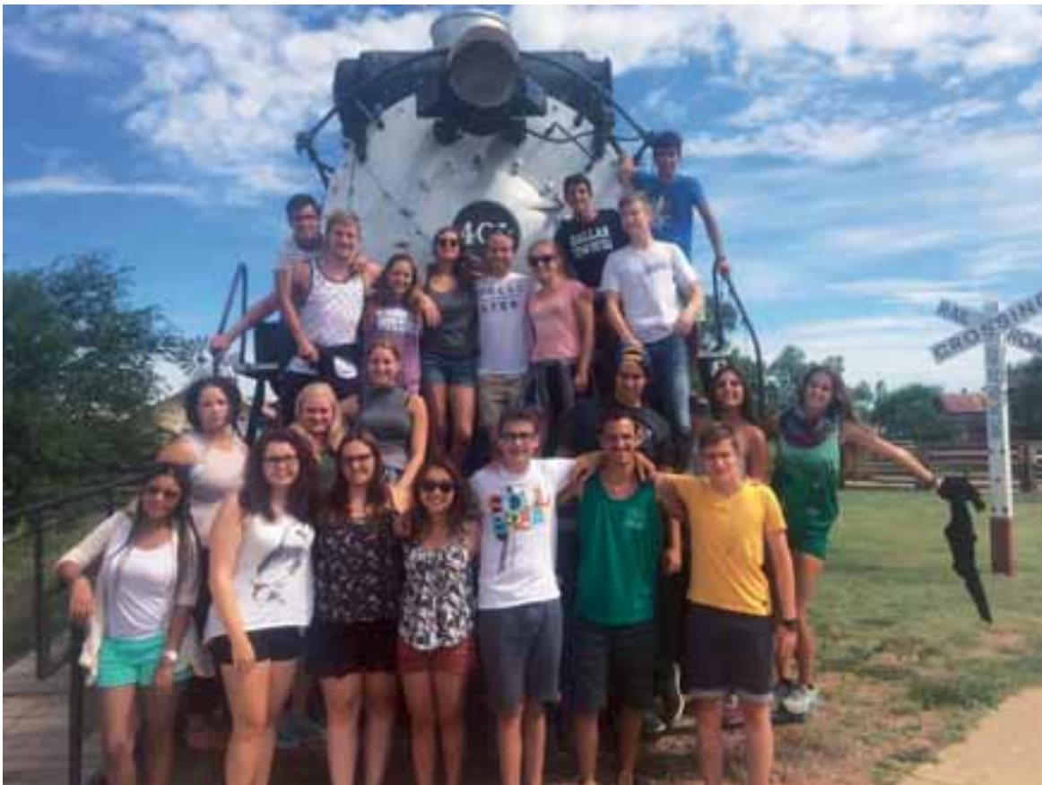
Kahlasimme nähtävyyksiä läpi 37 hengen leiriläisporukalla. Meitä oli yhteensä 22 eri maasta.

Ensimmäinen viikko meni aikaeroon totutella ja isäntäperheen kanssa rannikolla. Samalle viikolle sattui 4th of July eli Yhdysvaltain itsenäisyyspäivä. Juhlimme itsenäisyyspäivää meren rannalla satojen muiden ihmisten kanssa – raketin määrä oli päätähuimaava. Toinen viikko vietettiin Lake Texomalla leirillä muit-