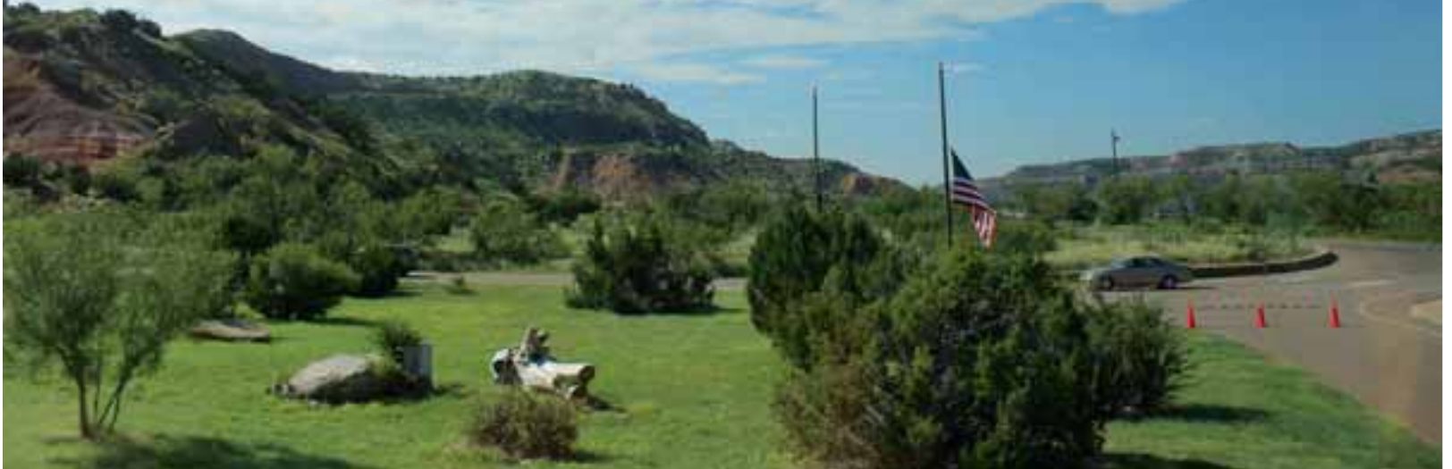
Palo Duro Canyonin maisemat olivat päätähuimaavan kauniit.