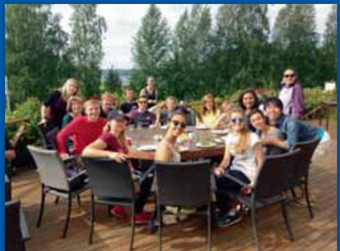
H-piirin iloisia nuorisoleiriläisiä.