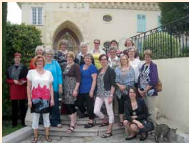
Liisoja klubin 15-vuotisjuhlamatkalla.

Parikymmentä LC Jalasjärvi/Liisat -klubin jäsentä otti pitkänä vappuviihkonloppuna varaslähdön kesään. Klubilaiset lensivät Nizzaan juhlimaan 15-vuotiaasta klubia ja presidentti Anun 50-vuotissyntymäpäivää.