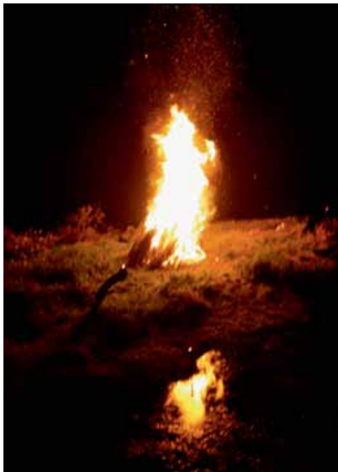
Talkoilla rakennettu kokko sytytettiin puolen yön aikaan veden äärelle, jolloin lieskat lyövät korkealle. Tuli heijastuu edessä olevasta lamasta myös alaspäin. Puut olivat valaistu nättisti ja veden päällä oli tulilauttoja.