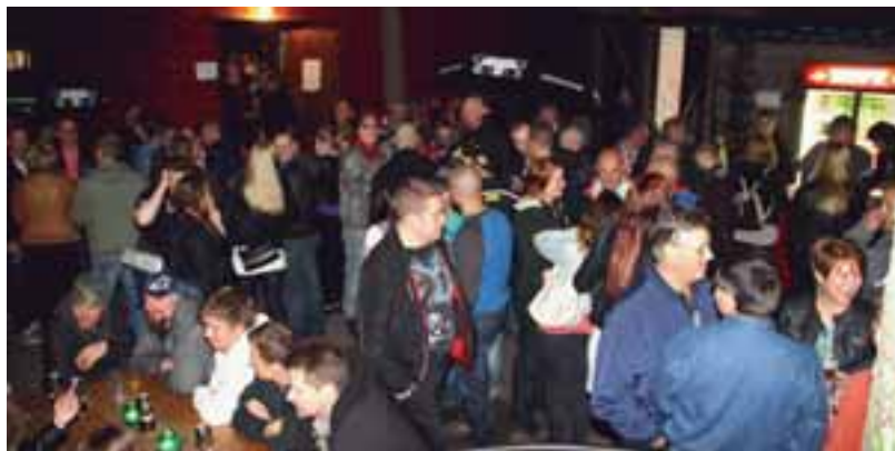
Lioneitten järjestämiin venetsialaisiin kokoontui noin 1 400 henkilöä, jotka viettivät iltaa elokuun iltana ulkona, tanssien, karaokea laulaen tai diskossa.