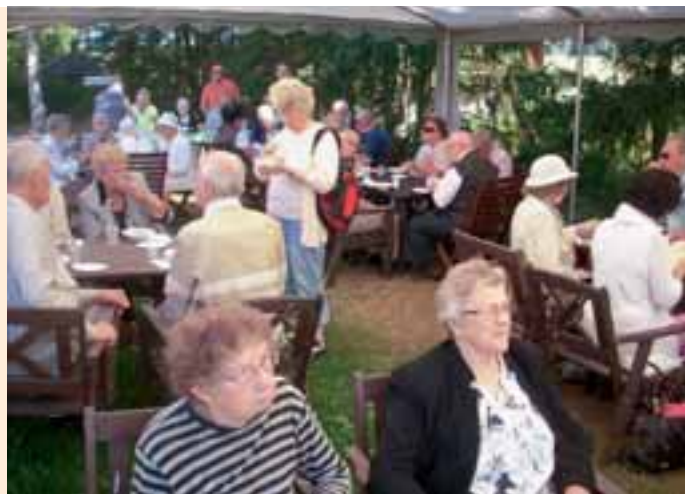
Soppa oli hyvää ja maistui vanikan kanssa. Jälkiruoaksi oli laitettu vielä kahvit pullan kera.