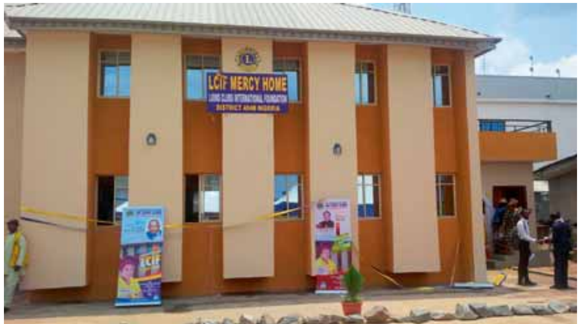
Mercy Home tarjoaa majoituksen potilaille.