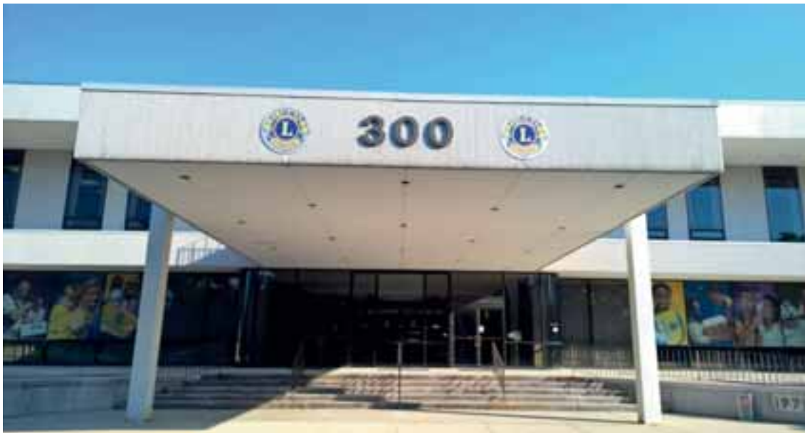
Maailman leijonien päämaja Oak Brookissa Chicagon lähellä.

Mieli palasi vasta äskettäin lomalta, mutta kalenteri näyttää jo syyskuuta. Elokuu oli vauhdikas kuukausi ja se näköjään katosi sisäisestä kalenterista yhtä vauhdikkaasti. Lehden ilmestymisen aikaan eletään jo lokakuuta.