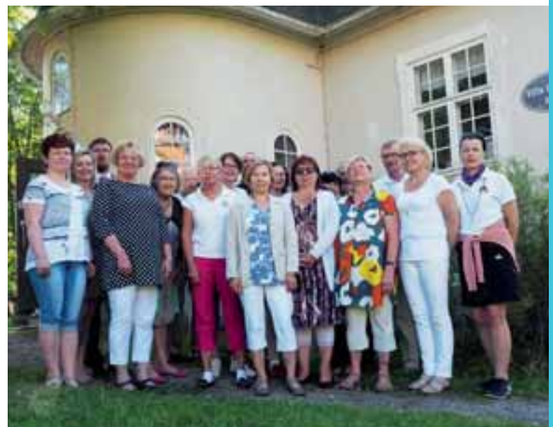
Lions Quest -joukko Kokkolassa.