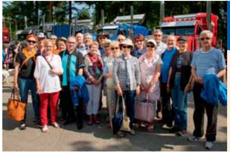
DG-kurssi 2006–2007 lähdössä tutustumaan Big Wheels -autonäyttelyyn.