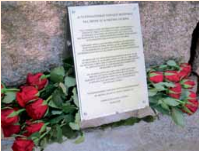
Muistolaatta on kiinnitetty Loviisan uuden hautausmaan muuriin pohjoisportin viereen.

Vuonna 1952 löydettiin Loviisan rautatiekadulta pihasaunan perustuksia kaivettaessa noin 40 pääkalloa ja runsaasti luita. Vainajia oli useissa kerroksissa, päät kohti koillista. Vaatteiden jäämiä ei hautapaikasta löytynyt, joten todennäköisesti heidät oli haudattu alasti 1790-luvun lopun suurten tautiepidemioiden yhteydessä.