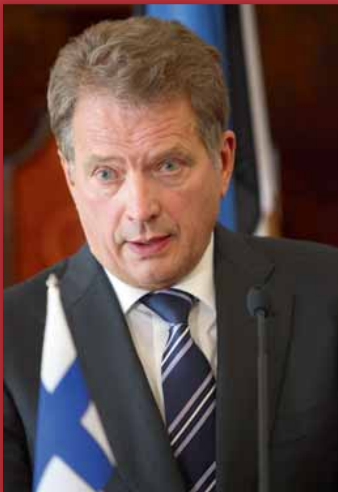
Republikens president Sauli Niinistö.

Värdighet, harmoni, medmänsklighet och många sätt att göra gott. För de här temana har vi fått en prominent beskyddare – Finlands president. Att förbättra möjligheterna för de unga är ett arbete som gynnar hela vårt lands framtid.