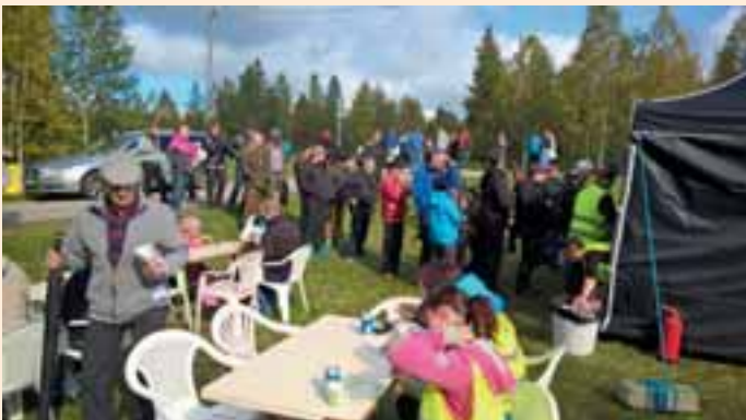
Ronja-ravintolassa riitti väkeä.