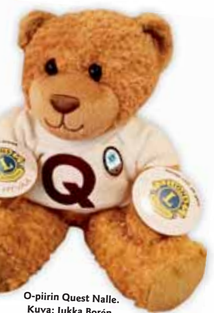
O-piirin Quest Nalle.

Lions Quest -joukko on jo ryhtynyt toimeen ja samaa toivomme kaikilta leijonilta. O-piirissä myös Quest Nalle on lähtenyt reissuun piiriku-