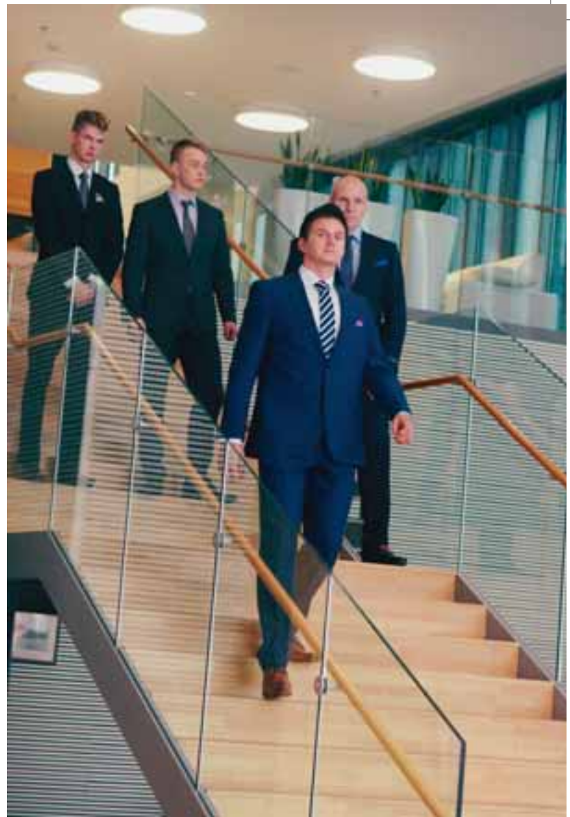
"Työmiehet" muotinäytöksessä. Pojat osallistuivat myös cocktail-tilaisuuteen ja ulkoiluttivat kerätyillä varoilla vanhuksia kesällä Koukkuniemessä.