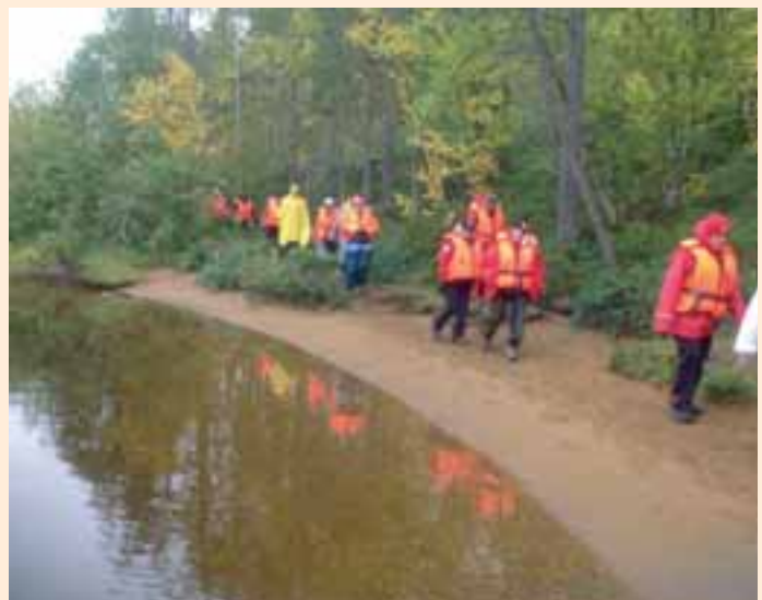
Juutuanjoki on paikoitellen niin matala että rantauduin kävelemään pari kohtaa.