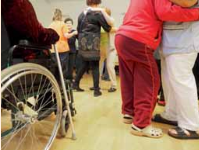
Pikkujoulut tanssien merkeissä ikäihmisille.

LC Valkeakoski/Rapola toimii aktiivisesti monella eri toiminnan alueella. Jäsenistö koostuu eri-ikäisistä aktiivisista ja toimeliaista naisista.