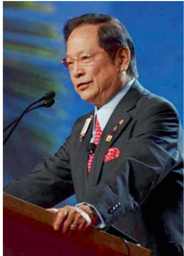
Lionsorganisationens internationella president, Dr. Jitsuhiro Yamada talar vid internationella årsmötet i Honolulu.