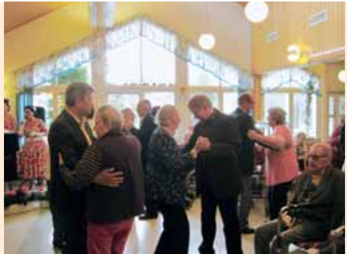
Kun tanssitaidon on kerran oppinut, kyllä sen taitaa vielä yksikymmppisenäkin, tiivistä eräs innokkaasti lattialle pyörähdellyt rouva.