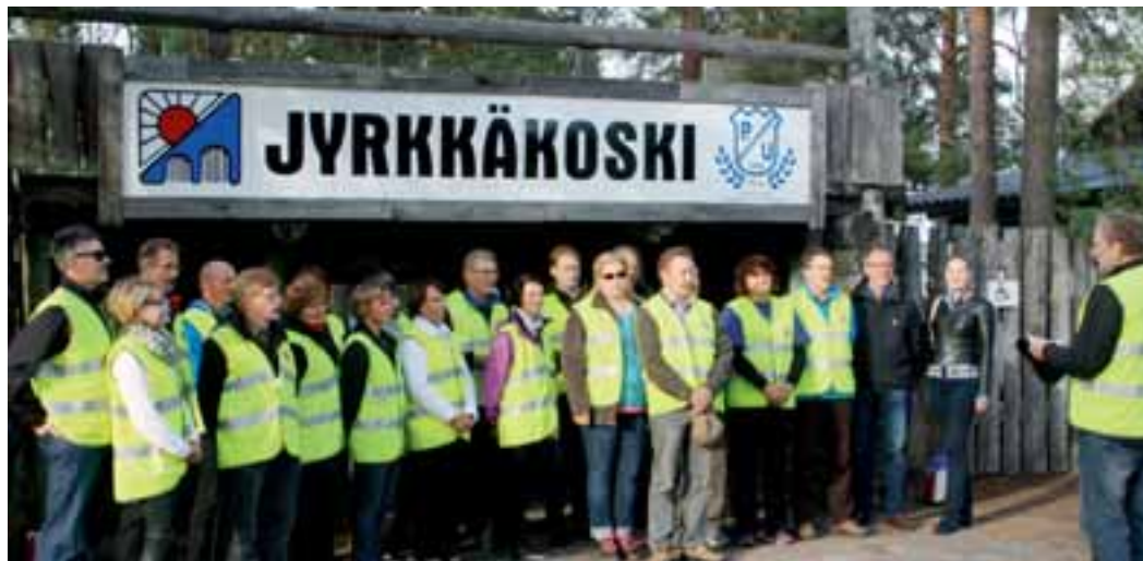
Lionsklubin talkoolaiset nostivat illan aluksi lipun salkoon, lauloivat leijonalaulun ja kokoontuivat yhteiseen kuvaan. Illan mittaan työtä riitti monissa eri tehtävissä.

Venetsialaisten järjestämisessä oli hyvin tärkeänä yhteistyökumppanina huvikeskuksen omistaja Pudasjärven Urheilijat, jotka järjestivät puitteiden lisäksi ruokailun ja ravintolamyyntin. Puolen yön aikaan sytytettiin Jyrkkäkosken rannalle talkootyöllä pystytetty kokko. Erilaisia tulia oli myös runsaasti tapahtumalueella ja Jyrkkäkosken partaalla vedessä lauttojen päällä, muodos-