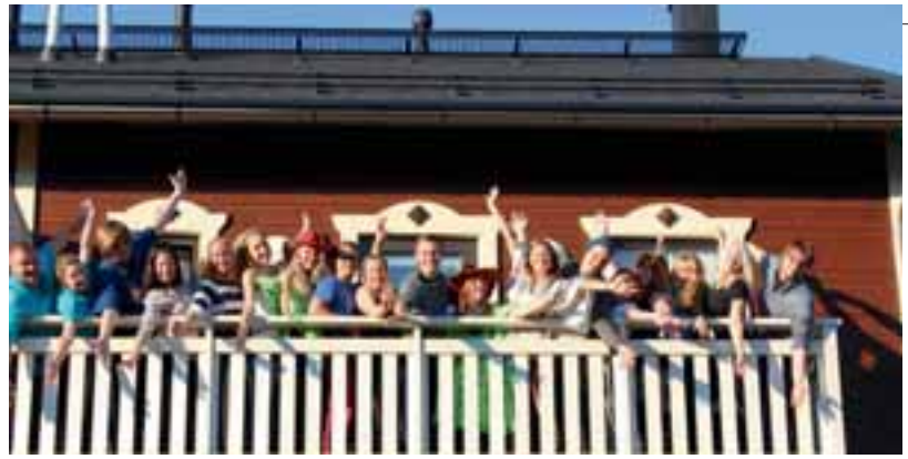
Koulutuspäivän osallistujat Himoksen viimeisissä auringon säteissä. Leoissa on valovoimaa!

Tommi esitteli myös Suomen Leojen uuden kansallisen aktiiviteettin yhteistyökumppanin: Iceheartsin. Se on järjestö, joka tarjoaa pitkäkestoista ennakoivaa lastensuojelutyötä tytöille ja pojille joukkueurheilun kautta, sekä tukea heidän vanhemmilleen. Ammatillisen pätevyyden omaavat kasvattajat sitoutuvat joukkueisiin ja lapsiin sekä heidän turvallisen kasvun ja kehityksen takaamiseen 12 vuodeksi. Voit