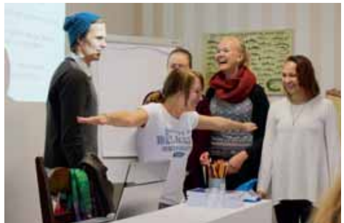
Kuka sanoi että tärkeästä aiheesta puhuttaessa pitäisi olla vakava? Sääntöjen esittelyn ei ainakaan tarvitse olla vakavaa.

Nähdään seuraavan kerran Talvipäivillä, ellei joku klubi ota leojen pikkujouluja omaksi elvytysprojektiin!