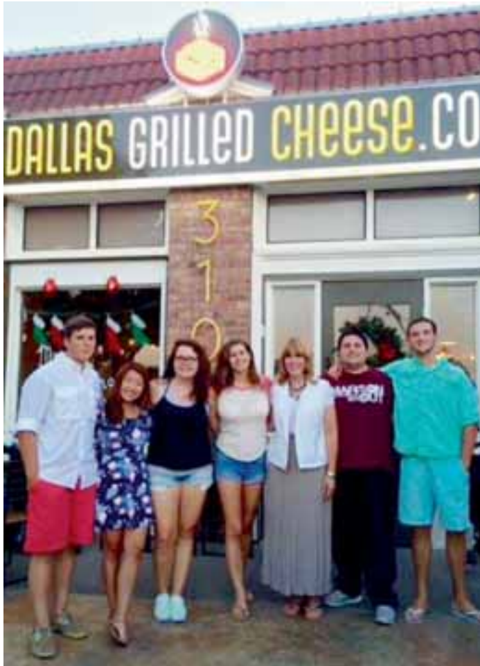
Isäntäperheeni oli paras, jota olisin ikinä voinut toivoa. Kävimme yhdessä mm. host-äitini ravintolassa.

ten leiriläisten kanssa. Kolmannen ja neljännen viikon aikana matkustimme hieman ympäri Texasia viettämään aikaamme kahdessa eri isäntäperheessä Austinissa ja Lubbockissa.