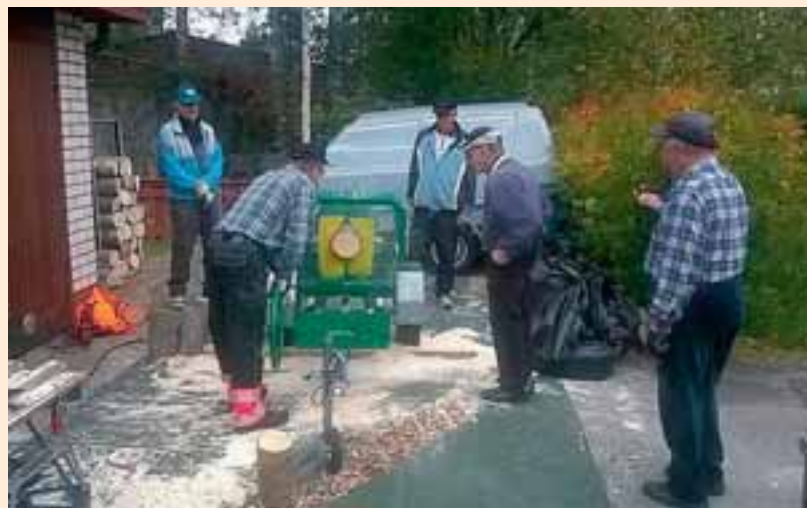
Pönttöjen valmistus alkoi heti syksyllä molempien klubien yhteistalkoissa.

K-Supermarket Välvainion edessä kaupattujen kotipesien myyntivalttina toimi ulkonäön lisäksi helppo ripustettavuus; pesät voi nostaa roikkumaan esimerkiksi puunoksasta joko metallisen lenkin tai puunhaarasta tehdyn koukun varaan. Näin kotipesän tarjoaminen pikkulinnuille ei vaadi työkaluja.