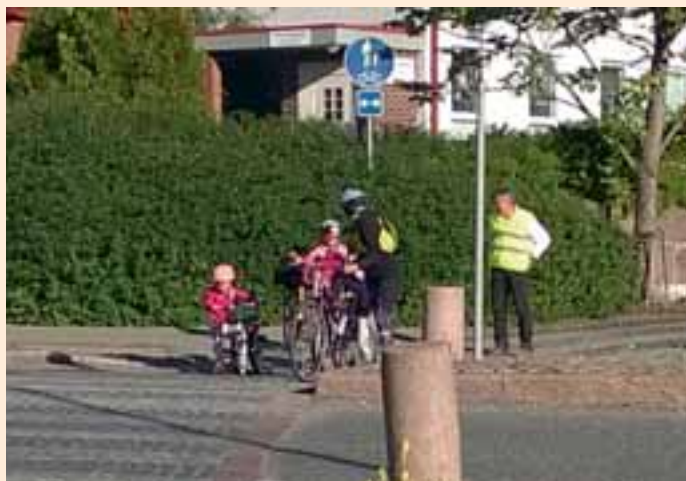
LC Kärkölen leijonat ahkeroinvat eskari- ja ekaluokkalaisten ensimmäisen koulupäivän turvaamiseksi.