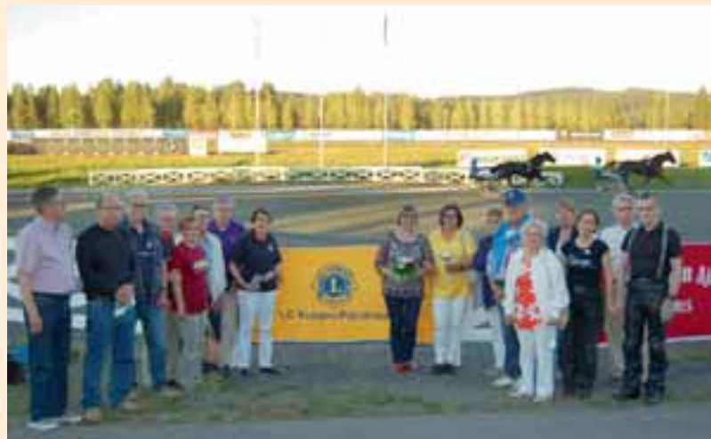
LC Kuopio/Päivärannan leijonat odottelemassa voittajaloimen kanssa nimikkolähdönsä voittajan saapumista esittelykehään.