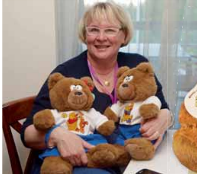
Uusi puheenjohtaja Quintuksen ja Quintinan kanssa.

Lisäämällä hyvää pahoinvointi vähenee. Elämisen taidot mitataan terveinä elintapoina, itsekunnioituksena, erilaisuuden hyväksymisenä, toisten auttamisena, mukaan otta-