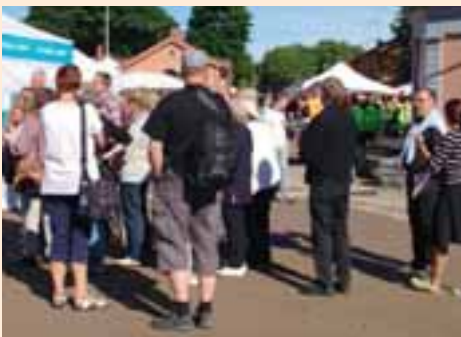
Tapahtumavieraita Suolatorilla jonottamassa leijonien Raflaan.

Loviisan leijonat ovat tässäkin tapahtumassa näyttävästi esillä avaamalla Loviisan historiallisella Suolatorilla oman "Pop up -ravintolansa". Leijonien suuri tarjoilualue käsittää telttakokonaisuuden, jossa klubin soppa- ja grilliryhmä myy aitoa armeijan soppatykyssä keitettyä hernerokkaa sekä grillimakkaroita, pisteenä iin päälle Loviisa Queenien suussa sulavat muurinpohjaletut.