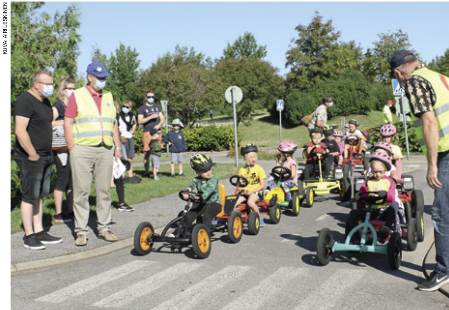
Turvallisesti koulutielle -tapahtumassa lapset saivat opastusta liikenteessä käyttäytymiseen.