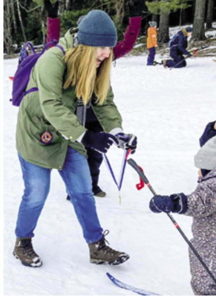
Kaikki nappulahiihtoon osallistuneet saivat mitalin.

Vaikka sää ei suosinutkaan, jaksoi ihmiset hymyillä ja nauttia mukavasta kevätpäivästä.●