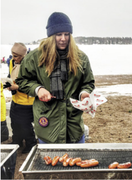
Matilda paistoi ja jakoi makkaroitu kävijöille Kevättempauksessa.

Avotuli lämmitti ulkoilijoita ja ihmiset herkuttelivat makkarapaistopisteellä – erityisesti hetkessä,