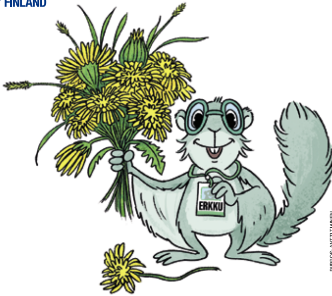
PIIRROS: ANTTI TIINEN