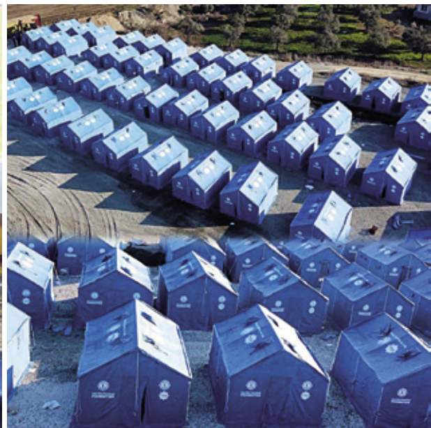
TURKIN TELTTAKYLÄ KAHDESTA ERI SUUNNASTA.