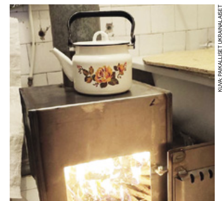
Sähkö- ja kaasupulasta kärsivillä alueilla kamiina saattaa olla ainoa lämmönlähde.

Lahjoitusvarojen keräystä on hoitanut LC Sotkamo ja Omri puolestaan saamallaan keräysvaroilla kamiinoiden valmistuttamisen ja kuljetukset Ukrainaan yhdessä paikallisten yhteistyökumppaniensa avulla.