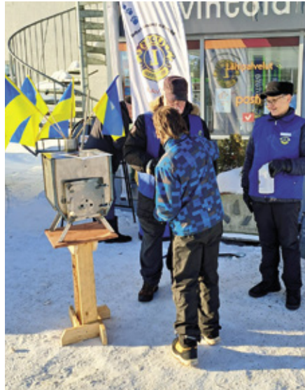
Lionien keräyksellä saatiin varat noin 200 Ukrainaan toimitettuun kamiinaan.