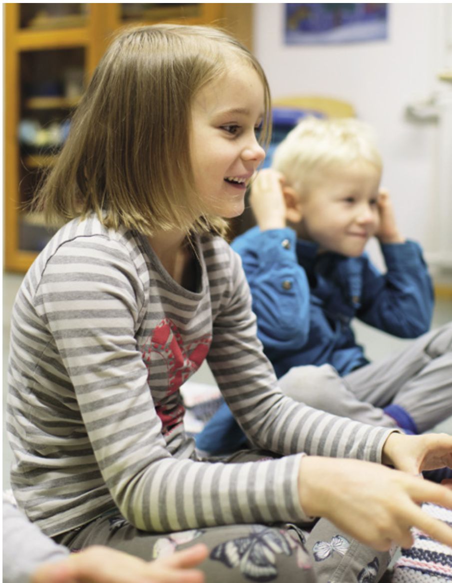
Ehdottomasti parasta Quest-koulutuksessa on se, että se vastaa ajan haasteisiin.