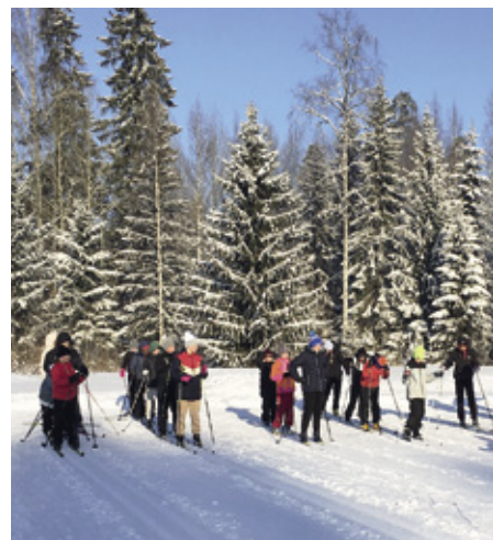
Mänttä-Vilppulan lionsklubit järjestivät jo kolmatta kertaa Lasten Leijonahiihdot.

Kampanjan keulakuvana on ollut artisti Etta . Hänen mukaansa kampanja oli ihan mahtava, koska se herätti oikeasti keskustelua muun muassa somessa tapahtuvasta kiusaamisesta. Maailma ei muutu, jos asioista ei puhuta rohkeasti.•