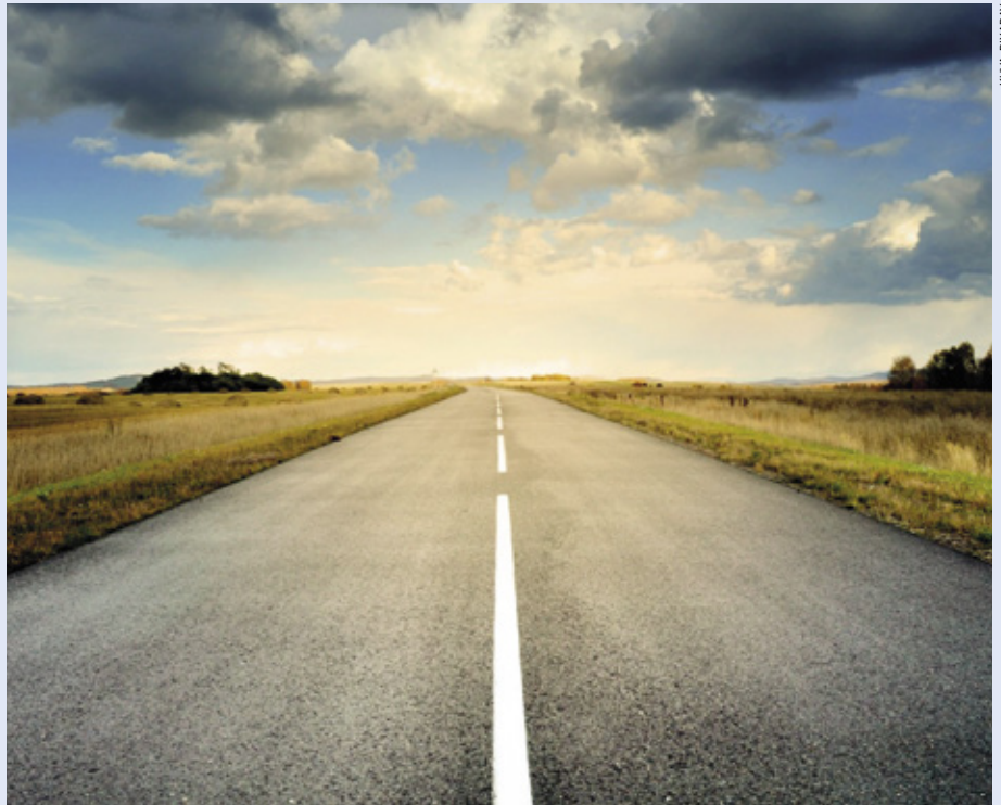
Armollisuus ja inhimillisuus ovat tärkeitä tekijöitä, kun ponnistamme kohti entistä voimallisempaa ja vaikuttavampaa lionstoimintaa.

Kun korona pääosin pysäytti klubien arkisen toiminnan, moni pitkään toiminut aktiivinen lion päätyi lopettamaan. Klubien jäsenmäärä laski 1 175 jäsenellä ja samalla jäsenmaksutuotot, jotka ovat noin puolet liiton tuloista, laskivat 38 000 eurolla. Onneksi jäsenmäärän laskun vaikutus klubien suorituskykyyn näyttää olevan vielä kohtuullisen vähäinen. •