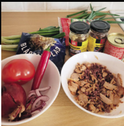
Tällä kertaa pizza valmistuu viimeisen käyttöpäivän kanalastuista.

Käytä keitettyjen kasvien tähteet ja lisää lisäksi tuoreita kasviksia. Kypsät broilerin ja lihan tähteet, lihapullat tai viimeistä käyttöpäivää olevat leikkeleet ovat myös loistavia täytteitä. Kokeile myös savustetun kalan jäännöksiä pizzaan, niin voit yllättyä positiivisesti.