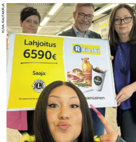
R-kioskin kampanja on lisännyt keskustelua tasa-arvosta ja häirinnän vastustamisesta.