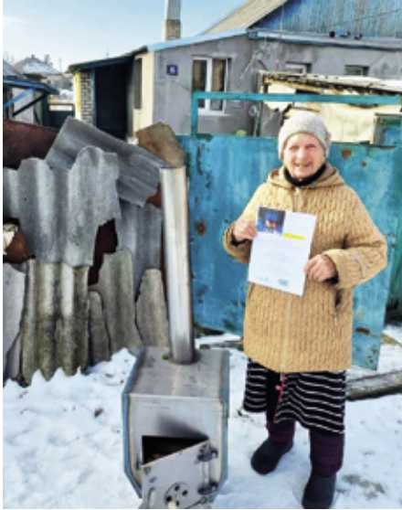
KUVA: PAKKAILISET UKRAINALAISET

Kamina on 54 senttiä korkea ilman savupiippua ja painaa noin 33 kiloa.