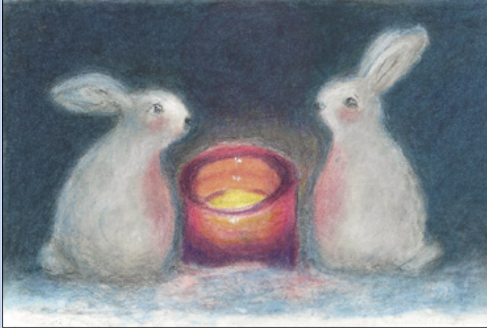
Sinikka Kervinen: Puput