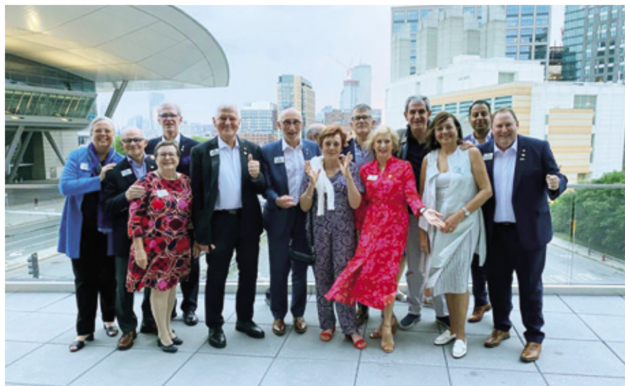
Periodens europeiska aktörer med makar och makor i Boston.

Det kommer att bli en intressant period – och en hel del att göra.