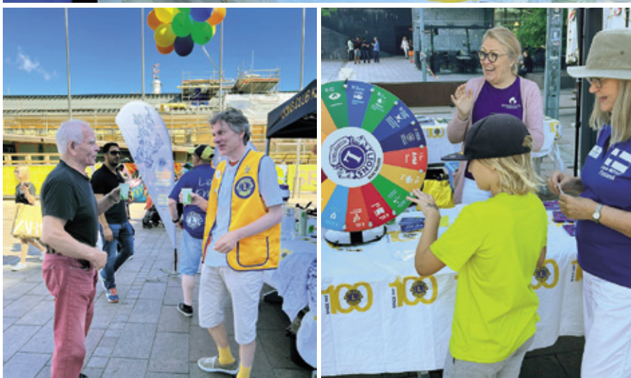
Helsingin Narinkkatori oli vilkas ohikulkupaikka, jossa jakamme lähdevesi, vesileijonan puraisu -siirtotatuointit ja ilmapallot kiinnostivat ohikulkijoita.