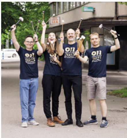
Orkester Norden kokoontui Lahdessa viikon harjoitusleirille.