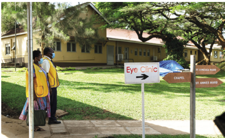
Puiden takaa näkyy kunnostettu ja laajennettu kaksikerroksinen näköklinikka.

Mainitut kaksi järjestöä ovat kumppaneina lahjoittaneet yli 420 000 USD kattavien silmienhoitopalveluiden laajentamiseen Kampalan suurkaupunkialueella. Kun klinikka valmistuu, sen odotetaan tarjoavan vuosittain silmätutkimuksia 20 250 opiske-