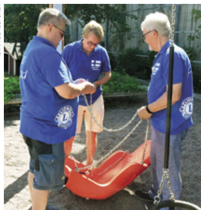
Keinu asennettiin saman tien paikoilleen ja sen kestävyys testattiin.

Myös keiloja ja palloja oli jo innolla odoteltu, sillä muutama työntekijä on käynyt sirkuskoulutuksessa ja ryhtyy nyt harjoittamaan niitä taitoja lasten kanssa. Näkövamma ei estä keilan tai pallon heittoa ja kiinniottoa, mutta on toki heikkonäköiselle haastavampaa. •