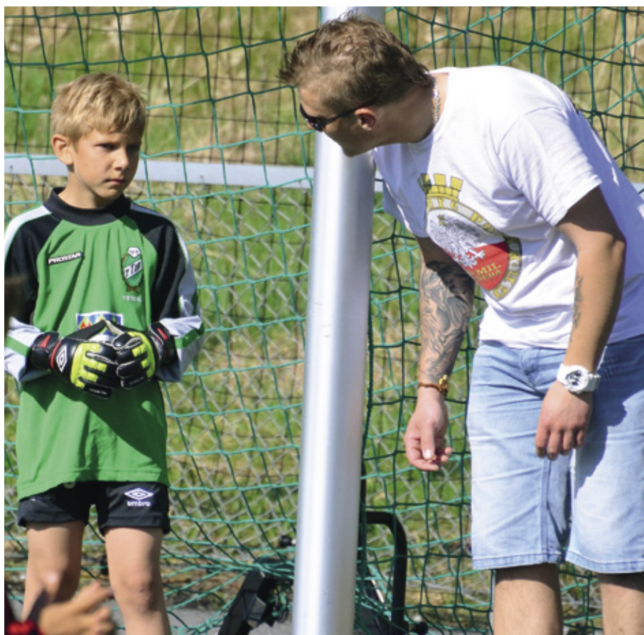
KUVA: MITT VALG NORJA

Itsemääräämisen teorian mukaan ihmisellä on kolme perustarvetta, joiden täytyminen määrittelee, kuinka omaehtoista motivaatio toimintaa kohtaan on: koetaanko pätevyyden ja hallinnan tunnetta sekä yhteenkuuluvuutta. Toiminta, jossa nämä tar-