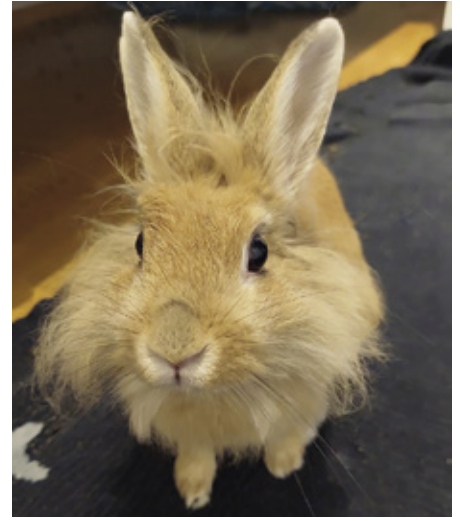
Justiina-kanin kuulumisia seurattiin viime hallituskaudella tarkkaan.