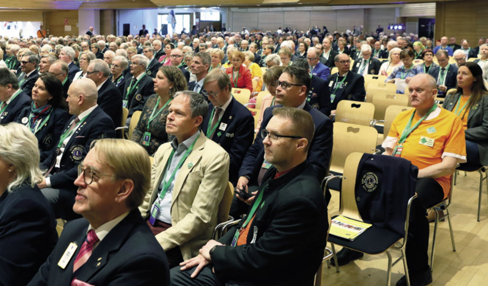
Liiton vuosikokoukseen osallistui 589 äänivaltaista kokousedustajaa 264 lionsklubista.