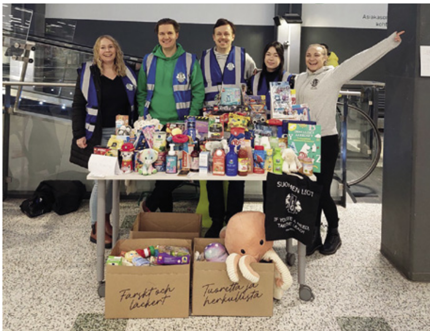
Leo Club Espoo/Downtown järjesti joulun alla Auta Lasta, Auta Perhettä -keräyksen Olarin Prismassa.