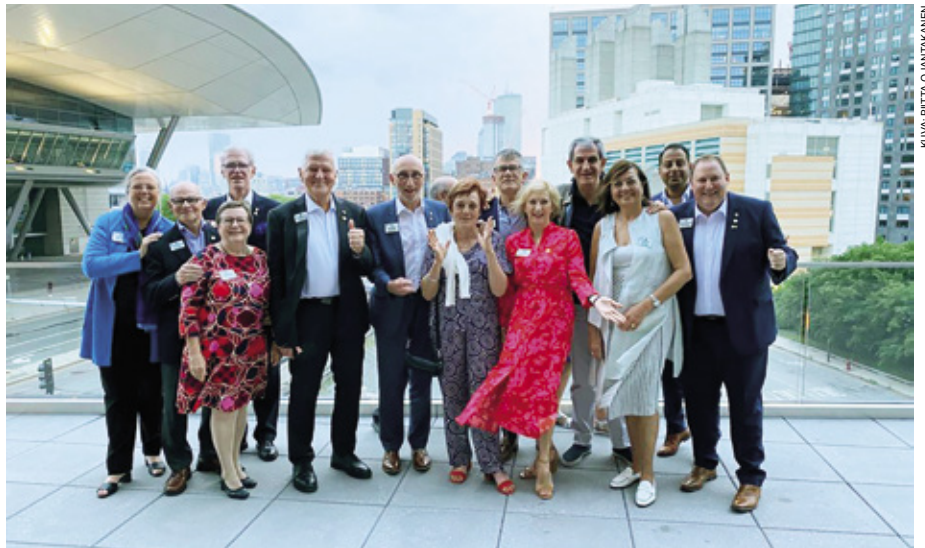
Eurooppalaisia tämän kauden toimijoita puolisoineen Bostonissa.

Kauden ensimmäisessä hallituksen kokouksessa koin merkityksellisen hetken. Presidentti oli pyytänyt minulta invocationin kokouksen alkuun. Invocation voi olla rukous, tai siinä voi käsitellä muulla tavalla eettisiä ja hyvää yhteistyötä korostavia asioita.