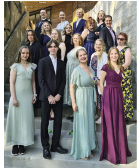
Parikymmentä leoa ympäri Suomen osallistui Espoossa järjestettyyn vuosikokoukseen.