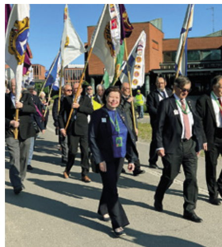
Lördagsmorgonen inleddes med en jubileumsmarsch till Dipoli med över 250 flaggbärare.